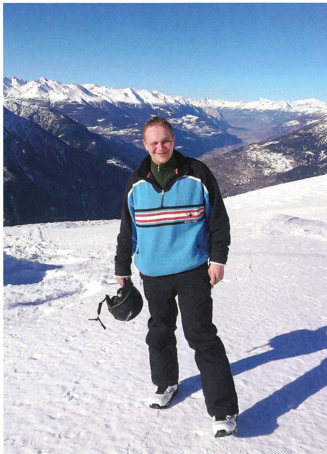
Ein Tag beim Snowboarden im wunderschönen Wallis auf dem Rossberg.

drücken musste erst wieder gelernt werden. Die BUSA machte es uns dahingehend so komfortabel wie möglich. Die Ausbildung wie auch die Ausbildungsthemen waren sehr gut organisiert und auch unsere Lehrer waren methodisch hervorragend geschult.