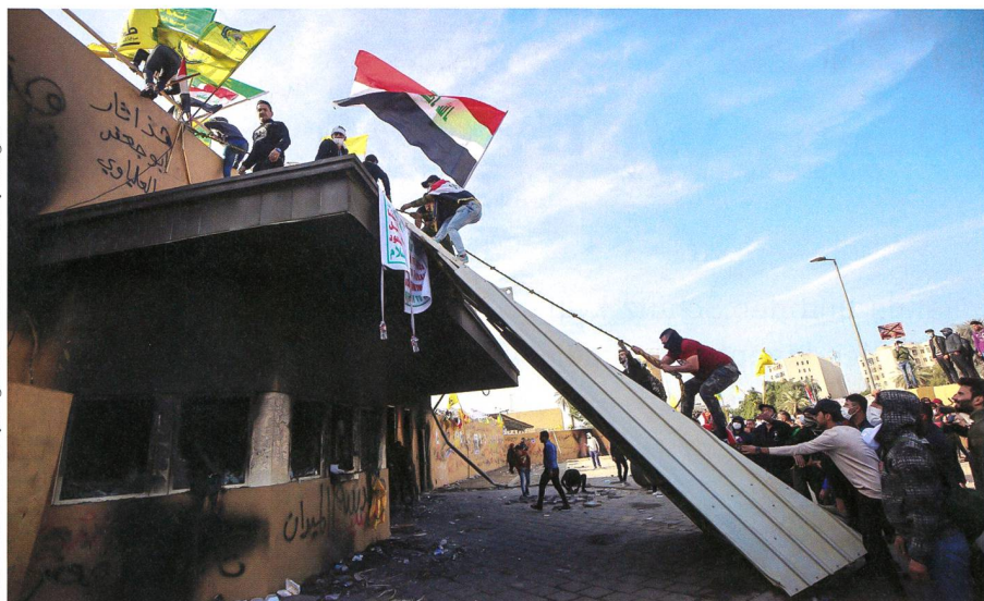
Irakische Demonstranten versuchen in die US-Botschaft einzudringen.

onsgarde war für «spezielle Auslandsoperationen» zuständig. Der Iran – und wohl auch Soleimani selber – glaubten, dass die Uniform sowie der Status als General des Irans ihn unangreifbar machten. Dieser Irrglaube wurde in der Nacht auf den 3. Januar 2020 zurechtgerückt.