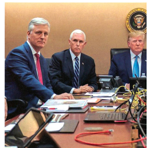
Trump mit seinem Stab im «Situation Room»