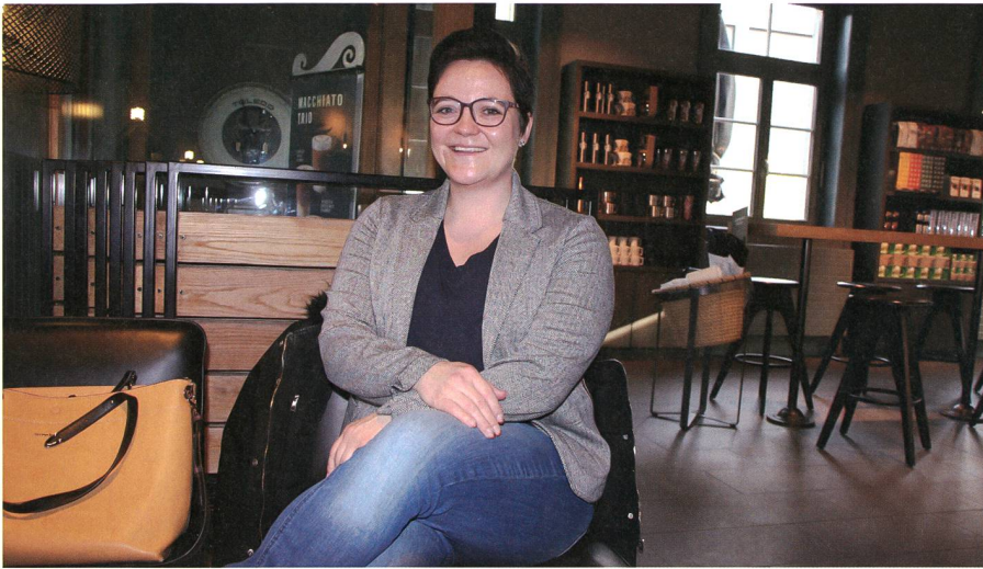
Nationalrätin Stefanie Heimgartner engagiert sich sowohl beruflich, wie auch in der Politik und der Armee.