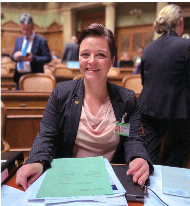
Bei der Vereidigung in den Nationalrat im Dezember 2019.

Nach der Rückkehr war sie im familieneigenen Transportgeschäft tätig, ehe sie einen Anruf vom künftigen NCC (National Contingent Commander) des 27. Kontingents bekam und so im Oktober 2012 ihr drittes Kontingent in Angriff nahm. Dieses Mal nicht mehr in der Funktion als Motorfahrer, sondern MA (Military Assistent) NCC. Auch im Einsatzort gab es einige Veränderungen, so war sie, zusammen mit dem Stab, im HQ (Head Quater), während der grösste Teil der Truppe in Prizren