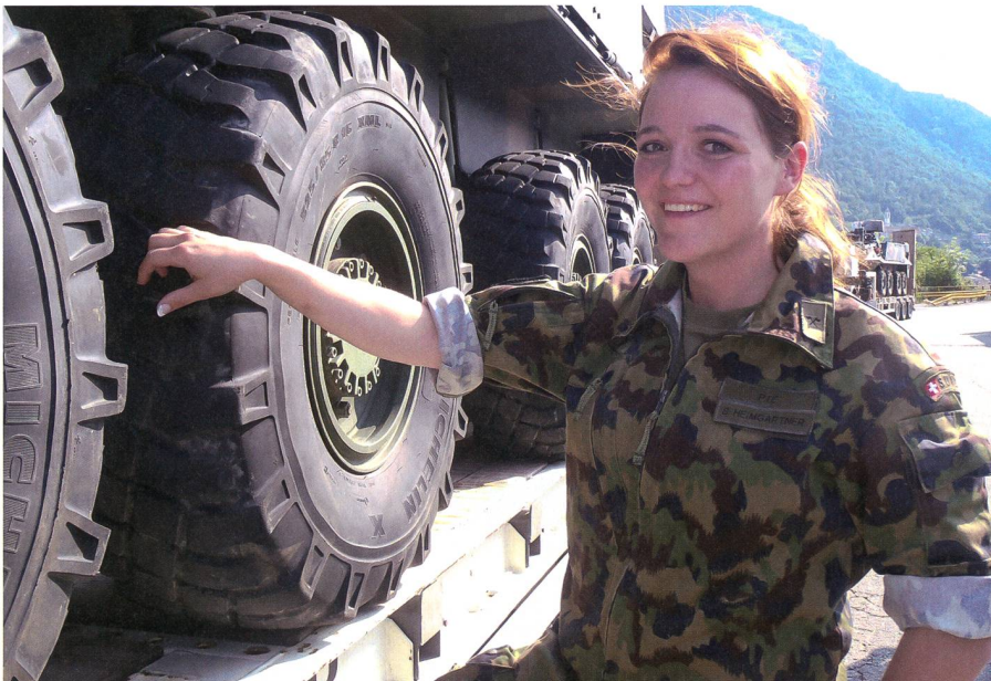
Neu im Nationalrat aber nicht in der Armee.