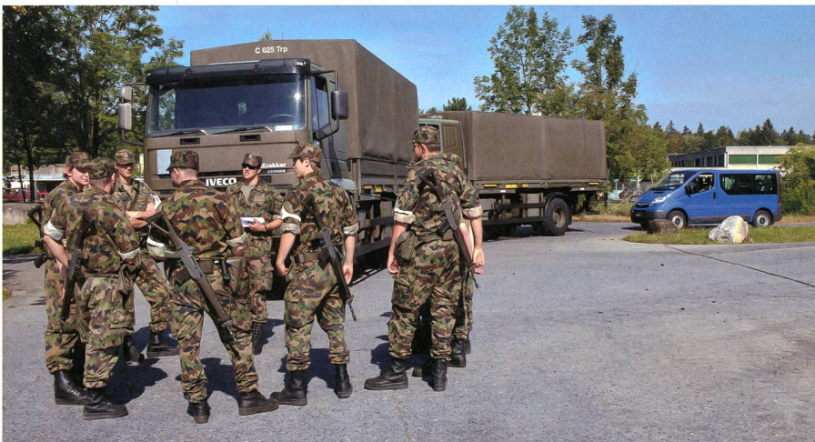
November 2006 wurde sie als Motorfahrerin ausgebildet (Symbolbild).