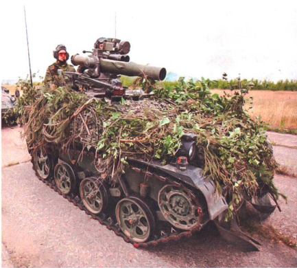
Neue Verbundstoffpanzerung CAMAC für den Wiesel.

Die FFG Flensburger Fahrzeugbau Gesellschaft mbH hat NP Aerospace mit der Lieferung von leichten CAMAC-Panzerungslösungen für die laufende Modernisierung von 181 Wiesel I über einen Zeitraum von zwei Jahren beauftragt. Die Wiesel I des deutschen Heeres werden als lufttransportfähige, leichte gepanzerte Kettenfahrzeuge für den Einsatz bei der Luftlandtruppe verwendet. CAMAC ist eine patentierte Multi-Hit-Panzerungslösung aus Verbundwerkstoff für neue und bestehende Plattformen gegen eine Vielzahl von Bedrohungen, einschliesslich klein- und mittelkalibriger Waffen, improvisierter Sprengkörper (IEDs) oder raketengetriebener Granaten (RPGs). Die ultraleichten Schutzelemente verbessern die