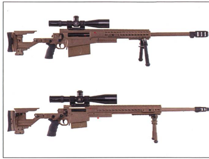
Zwei neue Scharfschützengewehre von Accuracy International.

Der britische Scharfschützengewehrspezialist Accuracy International (AI) bringt zwei neue Modelle auf den Markt, das AX MKIII und das AX50 ELR. Das AX MKIII ist für den militärischen Einsatz in Europa und weltweit entwickelt worden. Sie ist