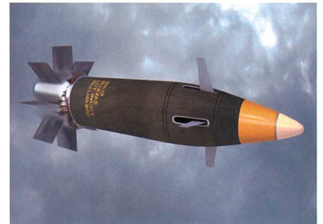
Präzisionsgelenkte Artilleriemunition EXCALIBUR S.

Raytheons präzisionsgelenkte Munition EXCALIBUR S erzielte bei Schiess-tests der US Navy direkte Treffer auf sich bewegende Ziele. Die Tests bestätigten damit die Fähigkeit des Projektils, aus ei-