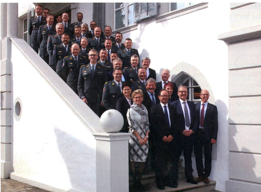
Zahlreiche Teilnehmer am Anlass der Kantone Ob- und Nidwalden.