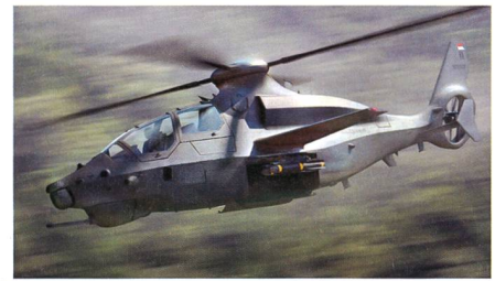
Bell 360 Invictus als möglicher leichter Aufklärungs- und Kampfhelikopter.

Die zwei übrig gebliebenen Wettbewerber sind noch Bell Helicopter Textron Inc. mit dem 360 Invictus sowie Sikorsky Aircraft Corp. mit dem Raider X. Jetzt fand durch die US Army eine «Down Selection» statt, nach der nur noch zwei Anbieter im Rennen sind. Diese erhalten jetzt einen Vertrag, um für Phase 2 des Projektes einen wettbewerbsfähigen Prototypen zu erstellen. FARA hat die höchste Priorität im Bereich der Modernisierung der Anteile Luft innerhalb der US Army. Benötigt wird ein Luftfahrzeug, das in einem komplexen Luftraum und in verschlechterten Umgebungen gegen Peer- und Near-Peer-Gegner mit einem fortschrittlichen integrierten Luftverteidigungssystem eingesetzt werden kann. Die derzeitige Flotte verfügt