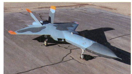
Sierra 5GAT zur Darstellung moderner Gegner.