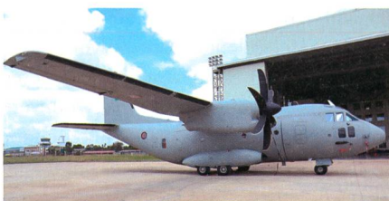
C-27J Spartan der kenianischen Luftwaffe.

Kenia hat kürzlich ihre ersten beiden C-27J Spartan offiziell in Betrieb genommen, damit wird Kenia in Afrika zum vierten Betreiber dieses Transporters. Kenia hat Ende 2017 bei dem italienischen Flugzeugproduzenten Leonardo drei mittelschwere C-27J Spartan Militärtransporter in Auftrag gegeben, die ersten zwei Ma-