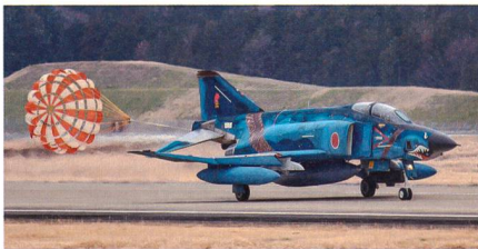
Ausmusterung nach 45 Jahren – RF-4E/J Phantom.

Die japanische Luftwaffe hat am 10. März 2020 ihre letzten RF-4E/J Phantom Aufklärer ausgemustert, die Aufgabe soll in Zukunft von der F-35A Lightning II übernommen werden. Die legendären Phantom Aufklärer waren auf der Luftwaffenbasis Hyakuri in der Nähe von Tokio stationiert und flogen während gut 45 Jahren in Japan als taktische Aufklärungsflugzeuge. Sie dienten bei dem Einsatzver-