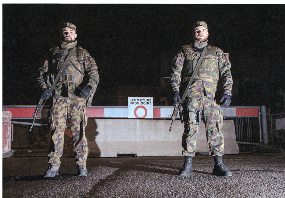
Geschlossen: Ein Soldat und ein Zugführer an der Grenze.