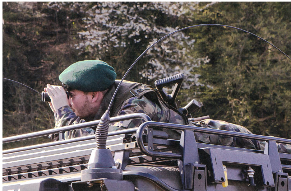
Ein AdA überwacht das Gelände im Grenzraum.