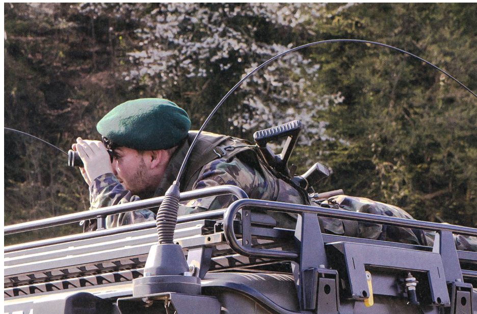
Ein AdA überwacht das Gelände im Grenzraum.