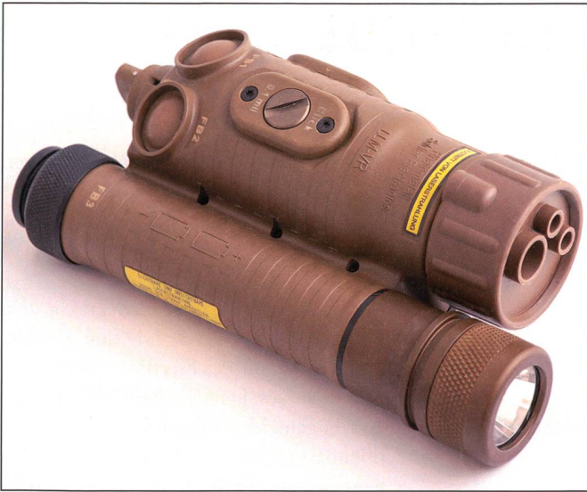
Laser-Licht-Modul Typ Vario Ray LLM.