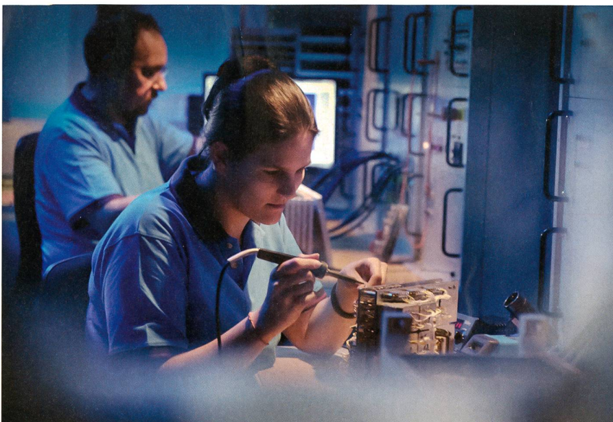
Fachspezialisten von RUAG prüfen aktuelle und neue Anforderungen an moderne Technologien.

Im Rahmen dieses Produktportfolios bietet RUAG aktuell auch eine bedürfnisorientierte Lösung für spezifische Projekte der Schweizer Armee. Die kosteneffiziente Lösung erfüllt die Forderung nach mehr Kommunikationskapazität bei erhöhter Mobilität. Als Technologiepartner der Schweizer Armee kennt RUAG die spezifischen Kundenanforderungen und die konkreten Einsatzszenarien. Das gebündelte Wissen als langjähriger Systeminteg-