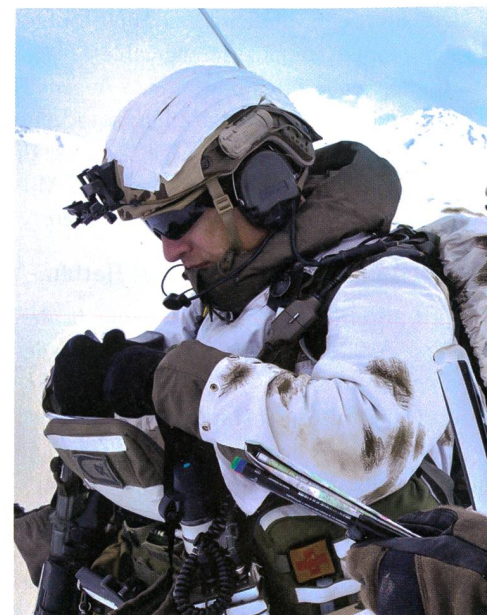
Sichere Kommunikation ist bei allen Einsätzen.