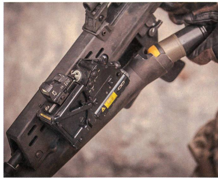
Feuerleitvisiere MR 500 und MR 800.