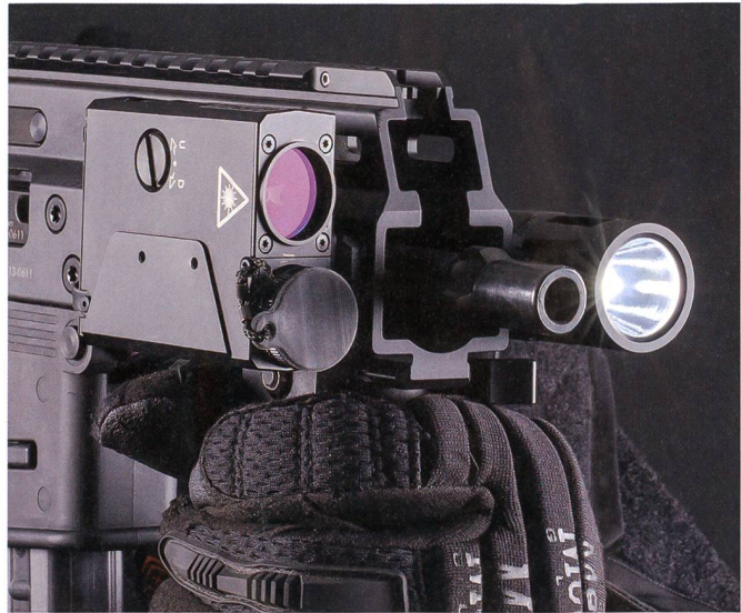
Twin Beam MK II.