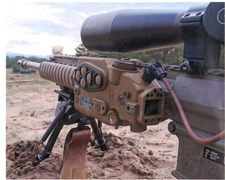
Anbaumodul Tac-Ray «Ballistic».

Entfernung. Der Benutzer kann dann das gewünschte Ziel selbst auswählen damit der Ballistikcomputer die entsprechende Berechnung korrekt ausführt. Im Computer können bis zu 32 verwendete Munitionstypen abgespeichert werden, damit eine möglichst einfache und schnelle Auswahl erfolgen kann.