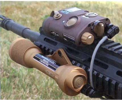
Laser-Modul VarioRay VTAL.