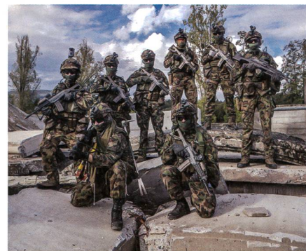
Unser Heer: schlagkräftig und vielseitig