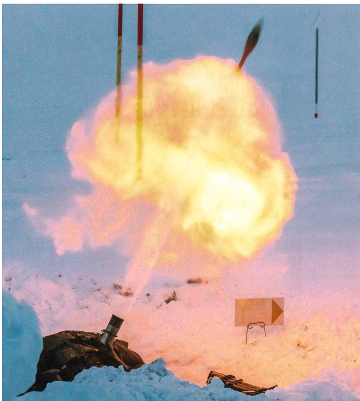
Feuer! Das grösste Kaliber der Infanterie im scharfen Schuss.

Nach vier WK als Unteroffizier habe ich mich entschieden die Offiziersschule zu absolvieren. Es war eine hervorragende