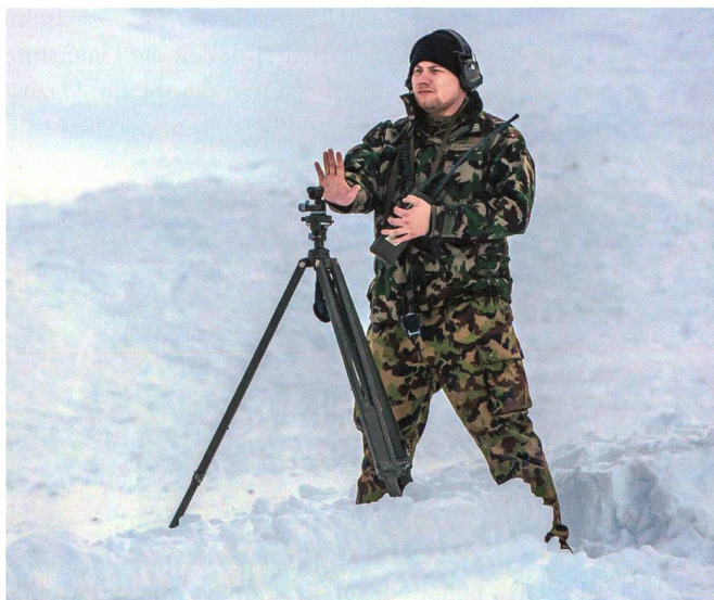
Es gibt keine Funktion auf die man verzichten kann und keine Schnittstelle die Fehler erlaubt.