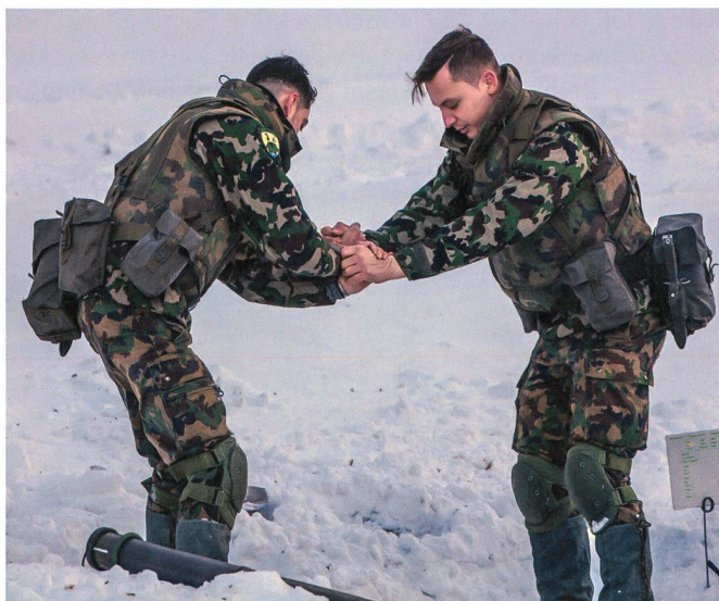
Teamarbeit: Für die Minenwerfer unverzichtbar.