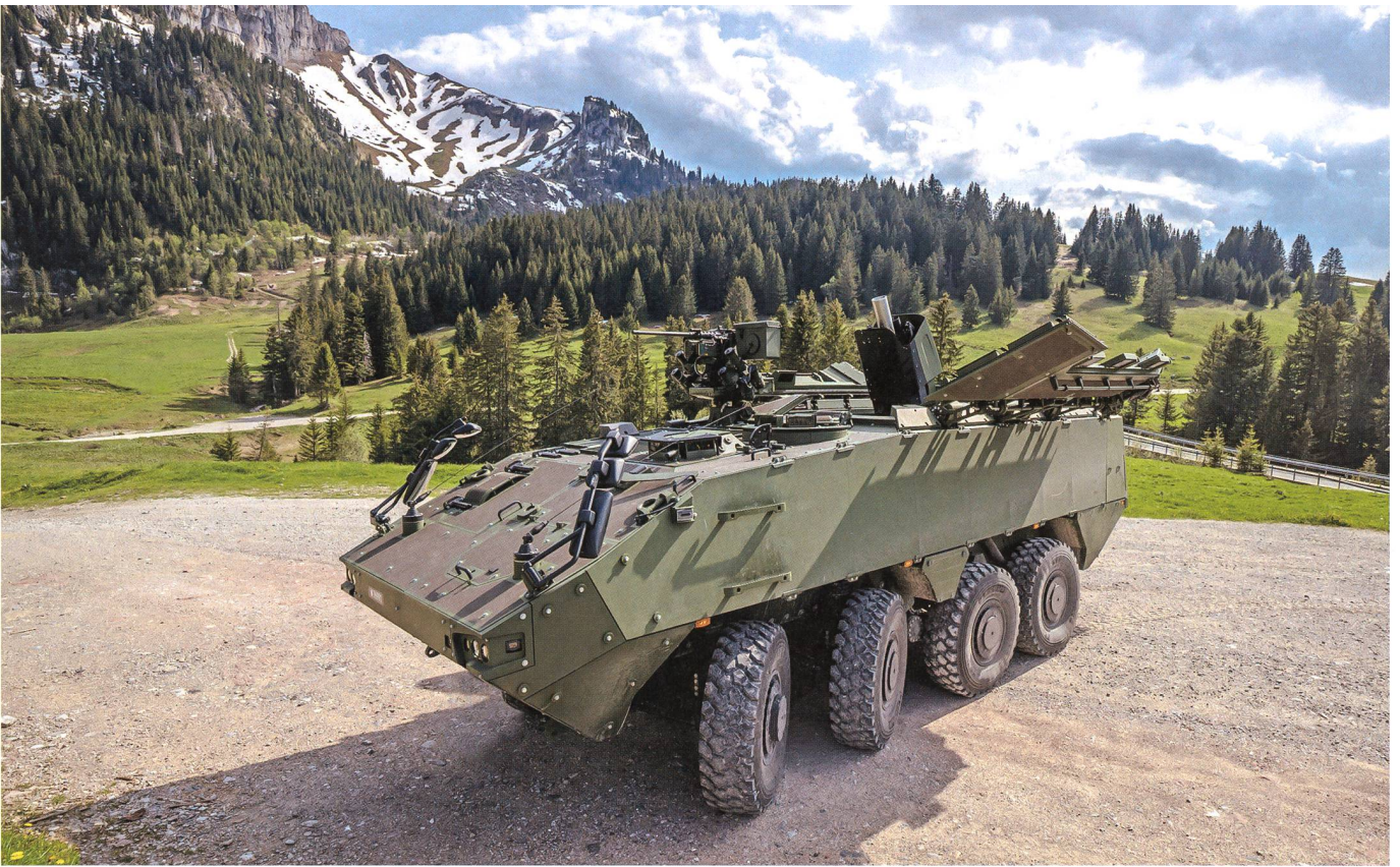
Das Gesamtpaket umfasst 32 Mörsersysteme (Trägerfahrzeug und Geschütz).