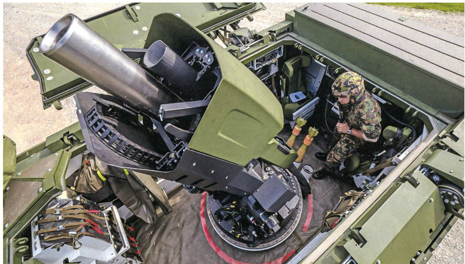
Das Waffensystem verschießt 120mm Granaten mit einer Distanz von bis zu 9 km.

Das Gesamtpaket umfasst 32 Mörsersysteme (Trägerfahrzeug und Geschütz), 12 Lastwagen, Munition, Logistikmaterial und die Anpassung von 16 vorhandenen Führungsfahrzeugen. +