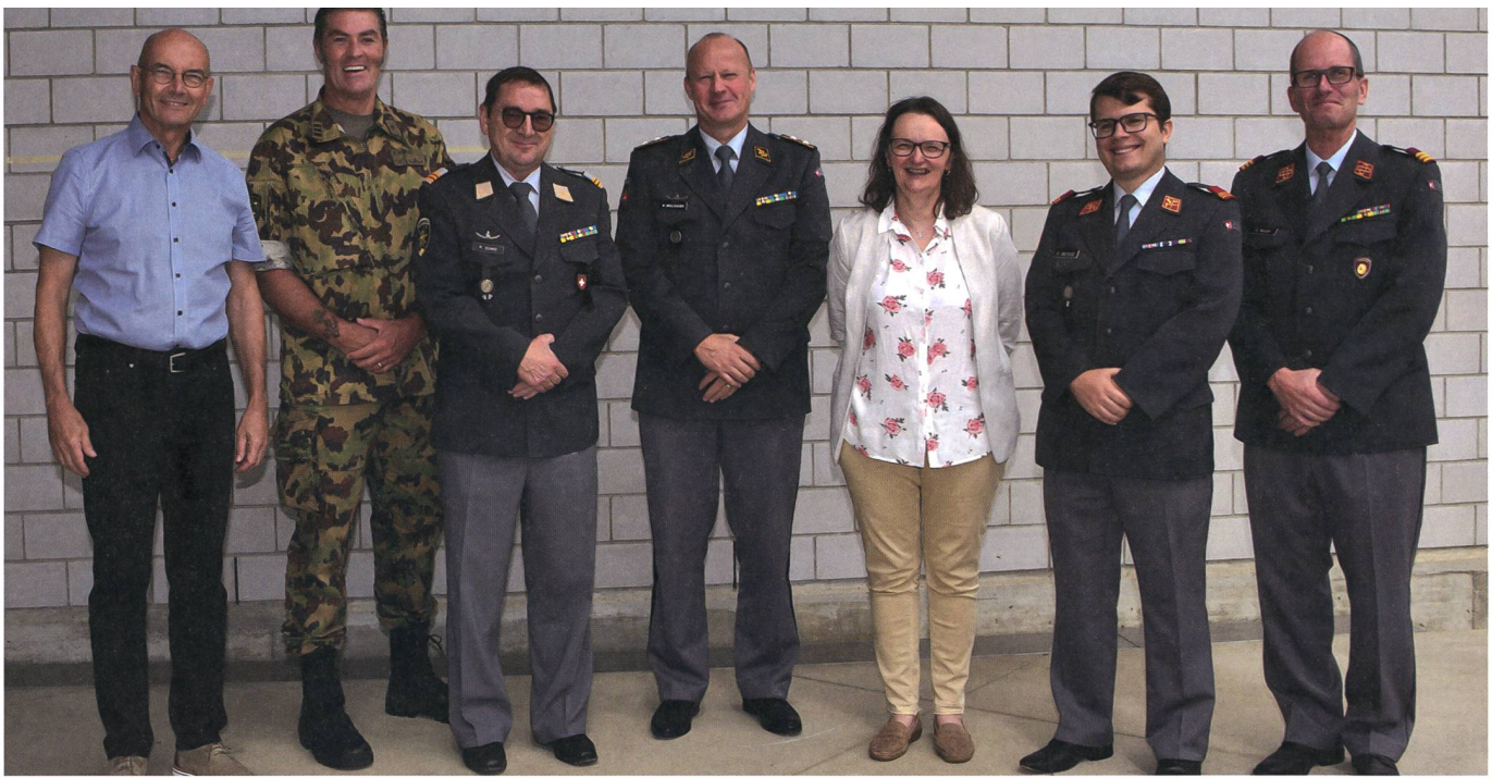
Bilder: Josef Rittler