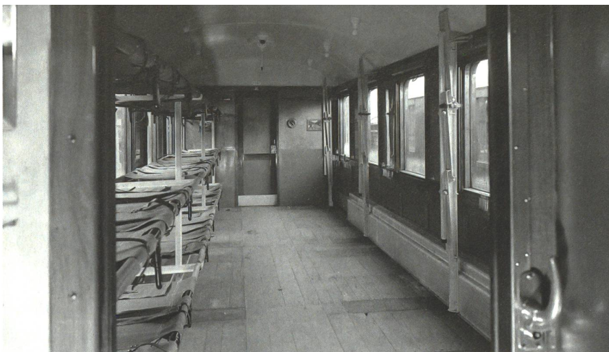
Ein Personenwagen der SBB, umgerüstet für den Transport von Verwundeten.

Zwei Wochen nach der erfolgreichen Mobilmachung der Armee konnte der Kriegsfahrplan bereits wieder durch einen