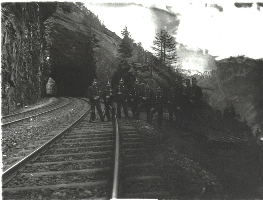
Bewachung der Gotthardeisenbahn im Ersten Weltkrieg.

Die Bildung des Militäreisenbahndienstes kann zeitlich etwas weniger genau festgelegt werden. Zwar wurde die schweizerische Eisenbahn bereits seit ihrem Geburtsjahr 1847 für Truppentransporte verwendet, ein wichtiger Grundstein für die Organisation des späteren Militäreisenbahndienstes (MED) wurde aber im Deutsch-Französischen Krieg gelegt.