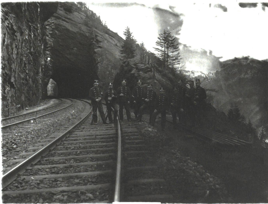
Bewachung der Gotthardeisenbahn im Ersten Weltkrieg.

Die Bildung des Militäreisenbahndienstes kann zeitlich etwas weniger genau festgelegt werden. Zwar wurde die schweizerische Eisenbahn bereits seit ihrem Geburtsjahr 1847 für Truppentransporte verwendet, ein wichtiger Grundstein für die Organisation des späteren Militäreisenbahndienstes (MED) wurde aber im Deutsch-Französischen Krieg gelegt.