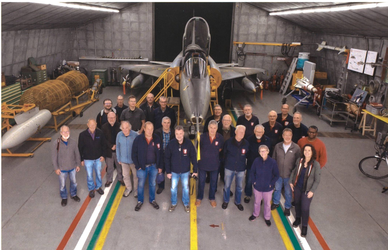
Der Mirage-Verein Buochs hat sich zum Ziel gesetzt, die 40 Jahre dauernde Ära des erfolgreichen Kampfflugzeuges MIRAGE III in der Schweiz in bescheidener materieller, vor allem aber in ideeller Form weiterzuführen.

und insgesamt neu 7500 Schweizer Franken pro Jahr auf die Seite stellen», erklärte Borgeaud. Dies sei ein existenzgefährdender und unsicherer Weg für den Verein.