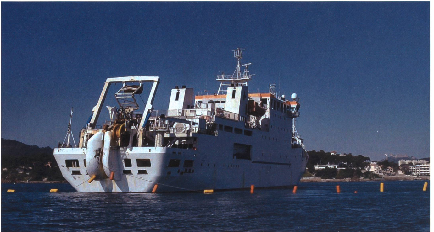
Frankreich verfügt mit der Teliri über ein Kabelgeschiff, das u.a. die Verbindung zwischen Frankreich und Singapur aufgebaut hat.

sche koordinierte Reparaturfähigkeiten aufbauen.