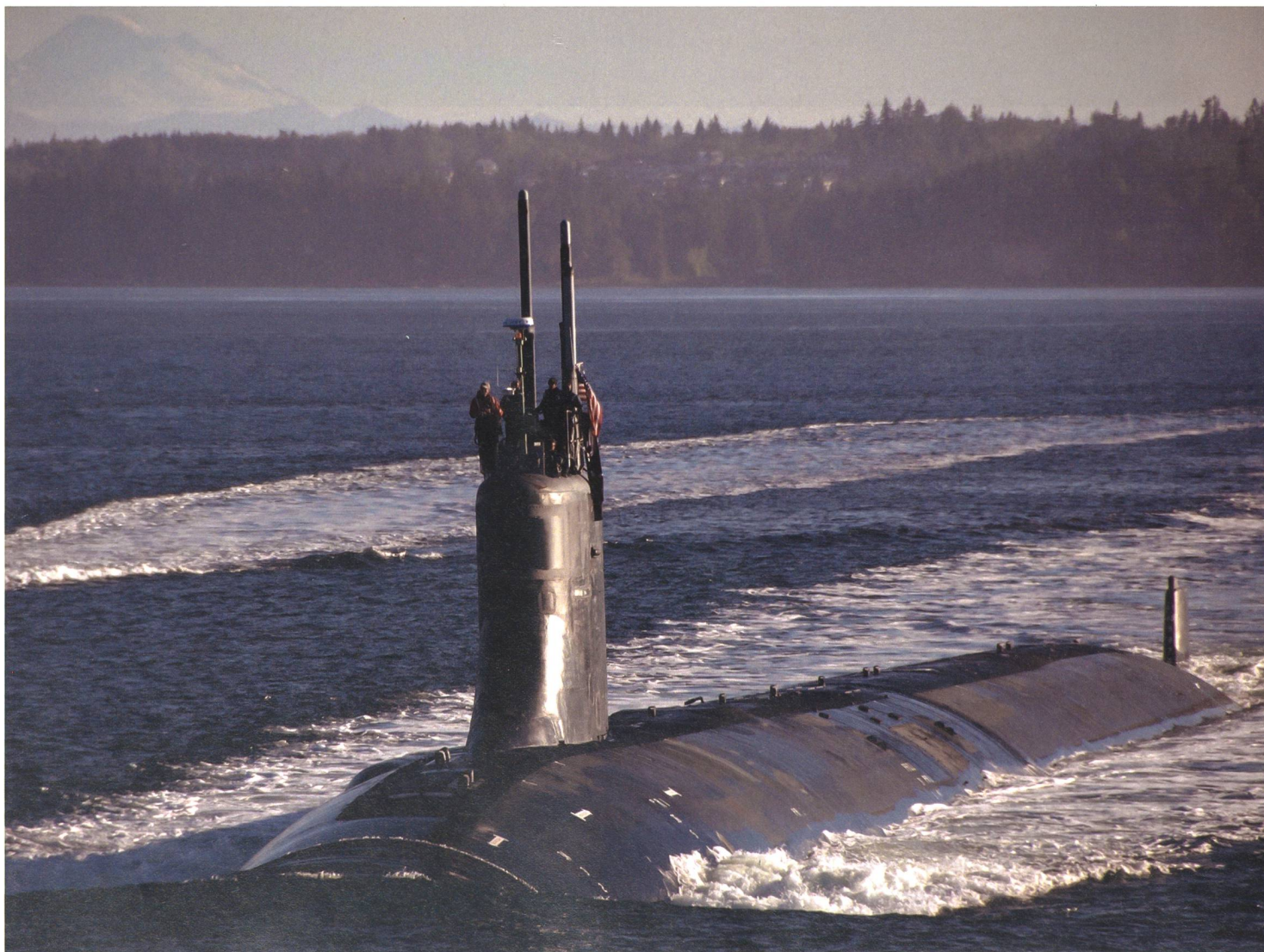
Das Spezial-Uboot USS «Jimmy Carter», ein Jagd-Uboot der Seawolf-Klasse ist für spezielle Operationen, u.a. mit Spezialkräften, umgebaut und verlängert worden. Man geht davon aus, dass es auch für Einsätze gegen Unterwasserinfrastrukturen eingesetzt wird.