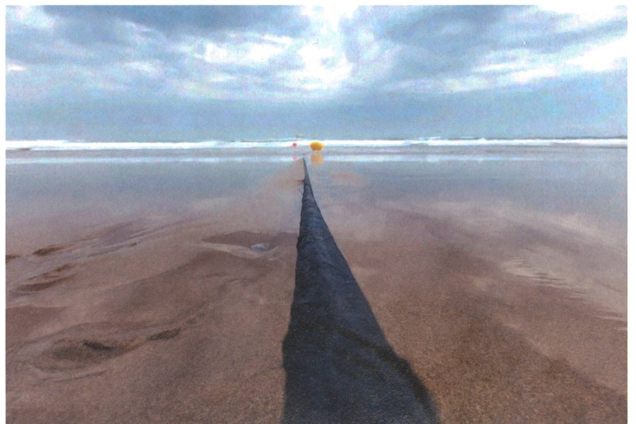
Diese Aufnahme zeigt ein Internetkabel, das ins Meer verlegt worden ist.

Es fehlt auch an Redundanzen. Private Aktivitäten und sicherheitspolitisch relevante Vorkehrungen müssen besser koordiniert werden. Noch geben sich viele Nationen bedeckt und verweigern sich der Schaffung von Transparenz. Zudem drängt sich eine internationale Regelung der Fragen im Bereich der Unterwasserinfrastruktur als Teil des See- bzw. Völkerrechts auf. +