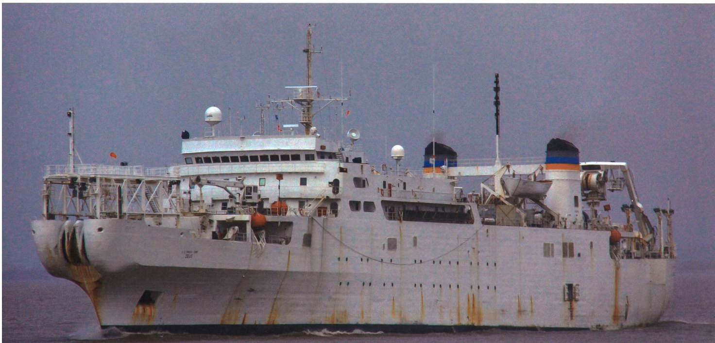
Die U.S. Navy verfügt über sehr wenige Einheiten zur Aufklärung und zum Einsatz gegen Unterwassereinrichtungen. Die über 8000 Tonnen grosse USNS Zeus ist das einzige Kabellege- und Reparaturschiff der Navy.

tale Komponente unterscheidet. Erstere geht auf die Unterbrechung und Zerstörung der Kabel aus, während letztere versucht, in die Netzwerke einzudringen, um diese abzuschöpfen, zu kopieren bzw. zu manipulieren.