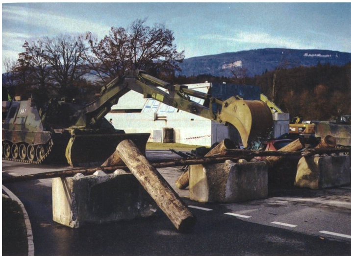
Panzersappeure räumen eine Strassensperre aus dem Weg.

gen können die Aufklärer kampflöse, terrestrische Aufklärung bei Tag und Nacht durchführen. Die Panzerjäger waren ebenfalls bereit, um gegnerische gepanzerte Fahrzeuge auf grosse Distanz zu bekämpfen.