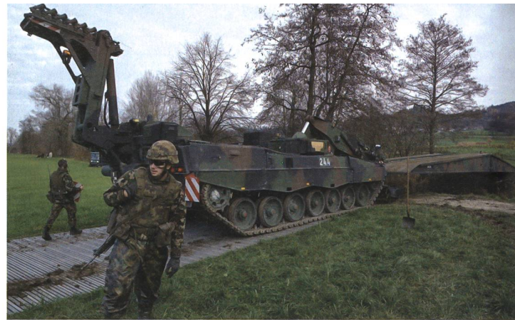
Die Panzersappeure sorgen im Einsatz für die nötige Mobilität.