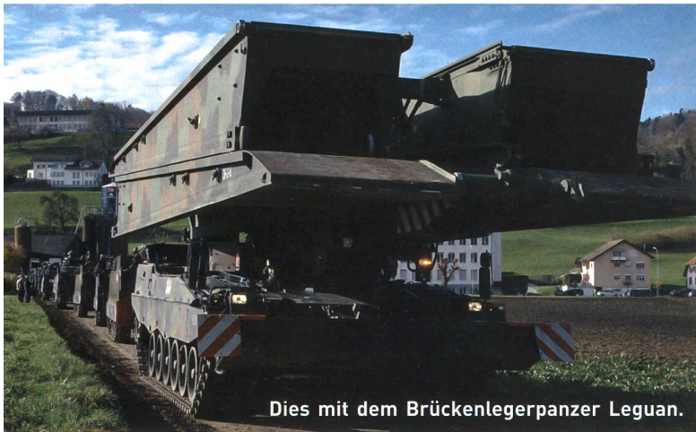
Dies mit dem Brückenlegerpanzer Leguan.