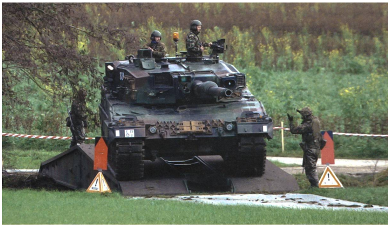
Bilder: Franz Knuchel