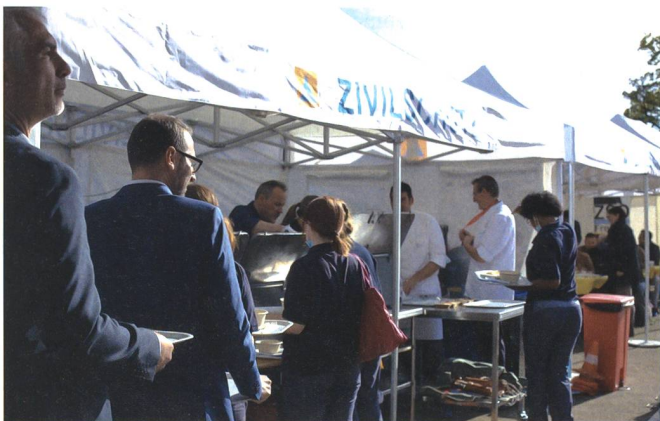
Um den Ernstfall, inklusive Material zu erproben, fand am 25. Oktober im Spital Muri ein «Feldküchen-Testlauf» statt.