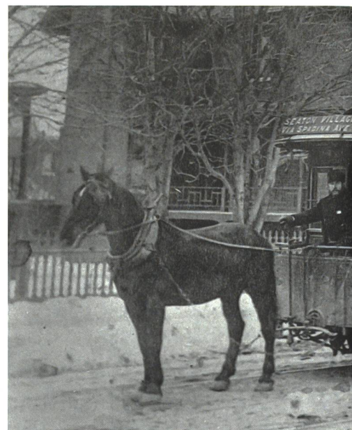
Nach dem Bürgerkrieg in den 1860er-Jahren schwang des Lebensstandards. Dies dank dem welche die Logistik stemmten.

Richten wir nun unseren Blick nach Amerika. Die Amerikaner erlebten nach dem Bürgerkrieg bemerkenswerte Veränderungen in ihrem Alltag. Angefangen von der Kleidung über das Essen bis hin zu den Möglichkeiten der Freizeitgestaltung. Versandhauskataloge ermöglichten es der Landbevölkerung, neue Geräte zu kaufen und die neuesten Trends in Sachen Mode oder Haushaltsgeräte zu verfolgen, ohne jemals ein Geschäft betreten zu müssen.