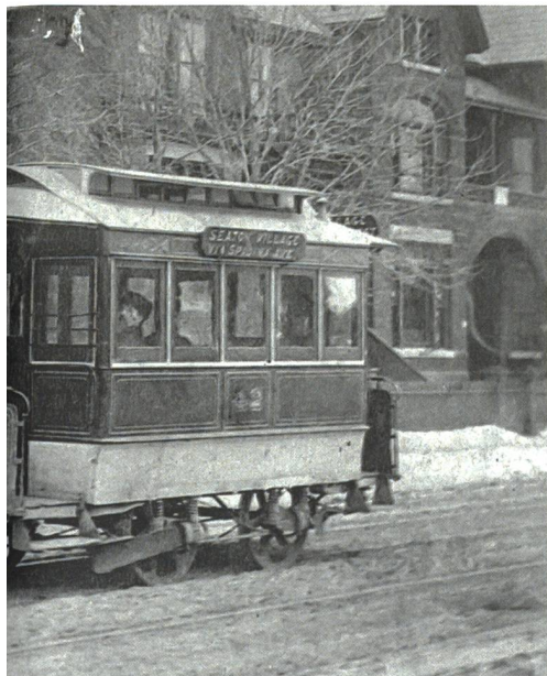
gab es in den USA einen rasanten Auf- flächenmässigen Einsatz von Arbeitspferden,

werden. Es entstanden Fabriken, Waren- und Lagerhäuser, damit die zeitnahe Bedürfnisbefriedigung der Kundinnen und Kunden sichergestellt werden konnte.