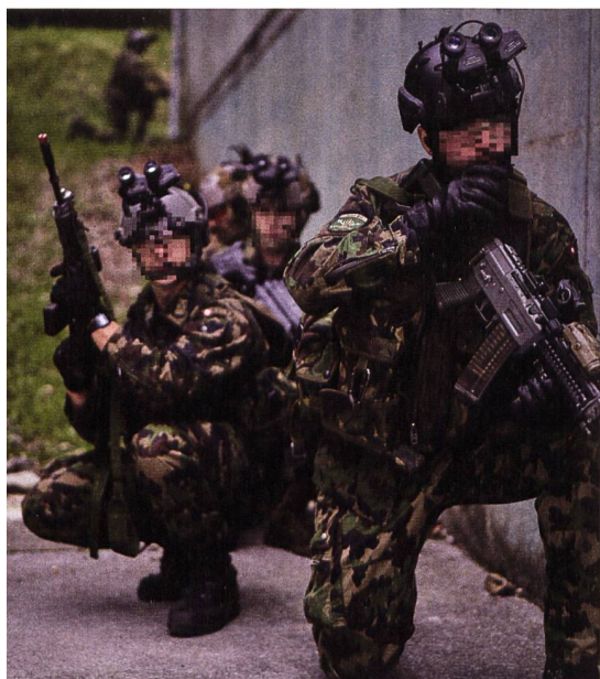
ExCP21 Team bereitet sich auf den Zugriff auf ein Zielobjekt vor.

Mit einer letzten Vorbereitungswoche, welche dank dem AZ SK in Isona, stattfin-