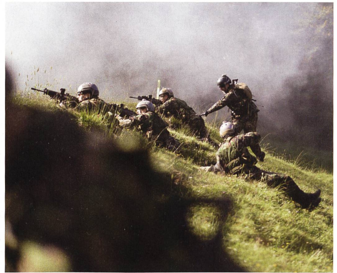
Feuer und Bewegung im offenen Gelände.

Startsequenz, welche mehrere Stunden vor ihnen gestartet waren.