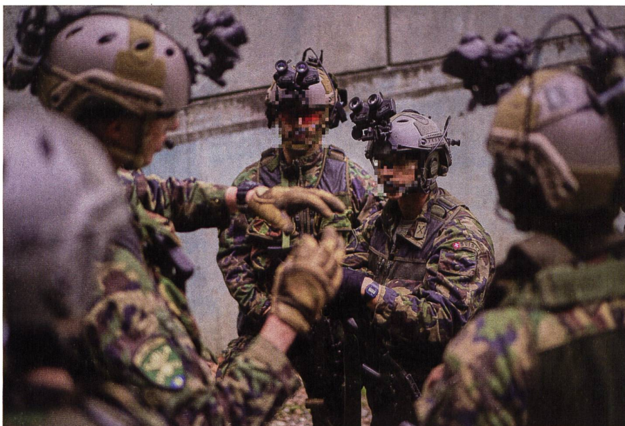
Teambesprechung nach einer Übung beim Häuserkampftraining.