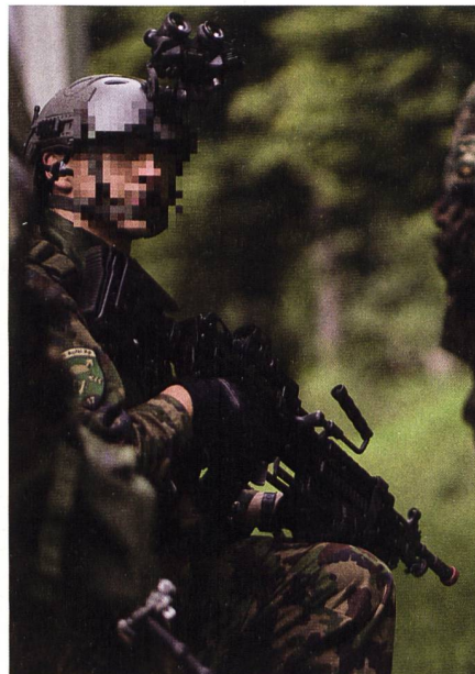
Operator des ExCP21 Team mit dem leichten Maschinengewehr 05 (5,6 mm LMg 05).