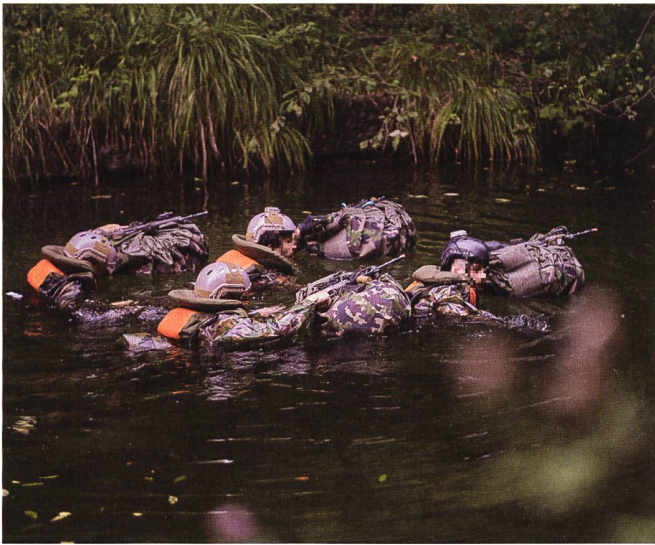
Eine Patrouille trainiert das Überqueren eines Wasserabschnittes auf der Marschroute.