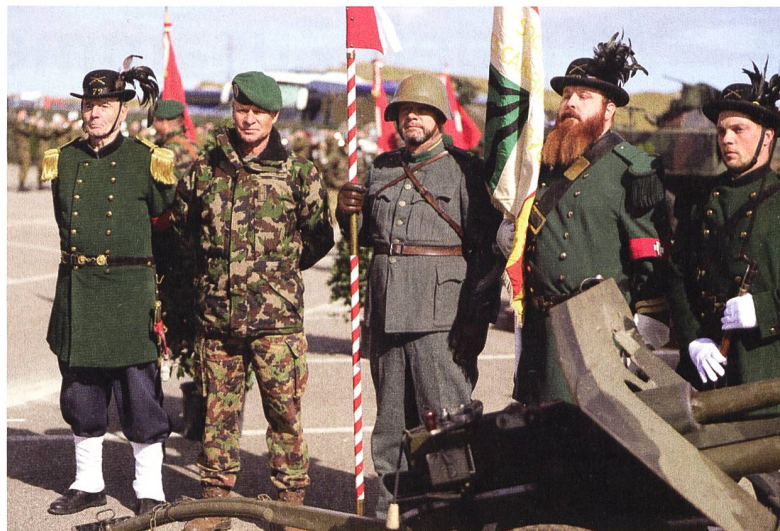
Kontinuität und Zukunft: Die Infanterie wird auch in Zukunft einen wichtigen Beitrag leisten.

Sie wird im Mittelland vorwiegend in Agglomerationen und im schwierigen Gelände eingesetzt. Der Lehrverband Infanterie ist mit seinen neun Schulen und Kommandos in der ganzen Schweiz verteilt. Die rund 360 Mitarbeiter des Lehrverbandes bilden pro Jahr durchschnittlich 6000 Soldaten und 1000 Unteroffiziere und Offiziere aus.