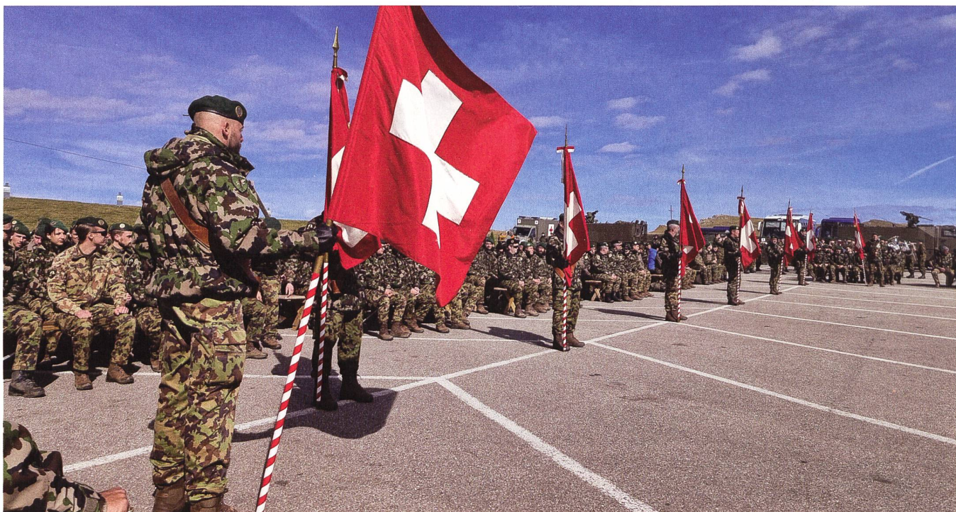
Rund 200 Teilnehmer besammelten sich zu früher Morgenstunde auf der Nordseite des Chasseral in Les Savagnières – Dessous.