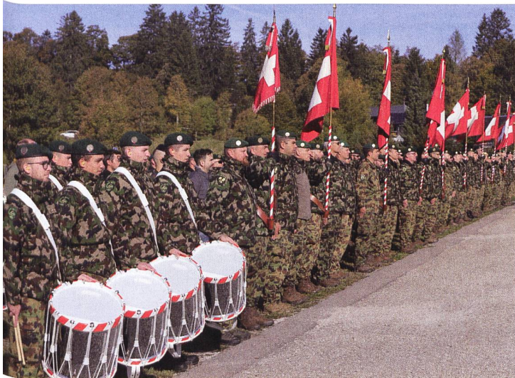
Fest steht: Die Infanterie wird auch in Zukunft einen wesentlichen Beitrag für Schutz- und Verteidigungsaufgaben leisten.