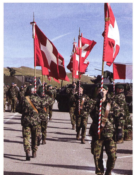
Die rund 360 Mitarbeiter des Lehrverbandes bilden pro Jahr durchschnittlich 6000 Soldaten und 1000 Unteroffiziere und Offiziere aus.

Dies hat unter anderem zur Folge, dass bei der Ausrüstung eine stärkere Ausrichtung auf mobile, modular einsetzbare und einheitlicher ausgerüstete Einsatzverbände vorgesehen sind.