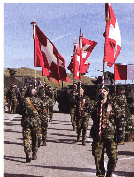
Die rund 360 Mitarbeiter des Lehrverbandes bilden pro Jahr durchschnittlich 6000 Soldaten und 1000 Unteroffiziere und Offiziere aus.