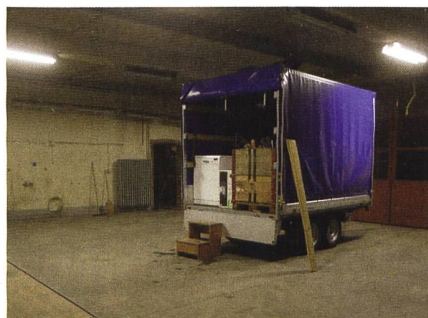
Nun ist auch der letzte Anhänger von Uster nach Bauma transportiert worden.

Jetzt ist es also endgültig Geschichte: das Zeughaus Uster als Homebase für den UOV Uster und die Cp 1861. Am Mittwoch vor dem Barbaratag - also am Mittwoch, 1. Dezember 2021 sind der UOV Uster und die Cp 1861 endgültig in Bauma angekommen. Die Vereinsleitung, aber auch der Kantonalverband wie auch der SUOV bedanken sich beim UOV Uster,