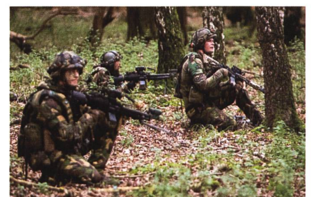
Niederländische Soldaten nehmen an den Zebra Sword Übungen in Amersfoort, Niederlande, teil.

Die Niederlande werden das Smash AD-System erwerben, das auf früheren Bestellungen bei Smart Shooter aufbaut. Die derzeitige Reichweite des Systems beträgt etwa 250 Meter, was der effektiven Reichweite von Sturmgewehren in der Hand entspricht. Experten gehen davon aus, dass das