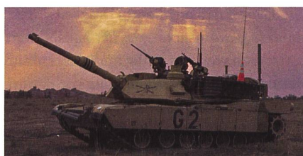
Ein M1A2 SEPv2 im Irak.

Das US-Verteidigungsministerium hat grünes Licht für einen möglichen Verkauf von Abrams M1A2 SEPv3 Kampfpanzern und zugehöriger Ausrüstung an Polen im