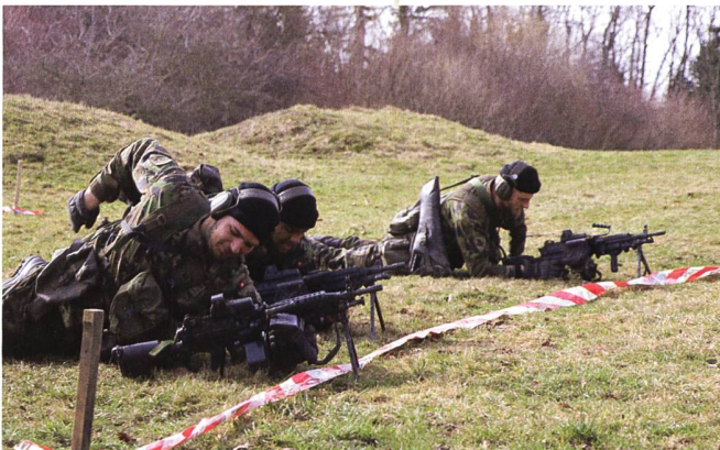
Auf der Drillpiste: Ausbildung am LMg.

Eine Infanterie-Gruppe besteht aus einem Gruppenführer sowie sieben Soldaten. Im Kampf kann sich diese Gruppe noch einmal aufteilen in zwei Trupps. Alpha und Bravo. Der Trupp Alpha wird dabei vom Gruppenführer (Wm) geleitet, während der Soldat mit der Spezialistenfunktion Truppchef den zweiten Trupp übernimmt. Die Soldaten in der Inf RS mit dieser Spe-