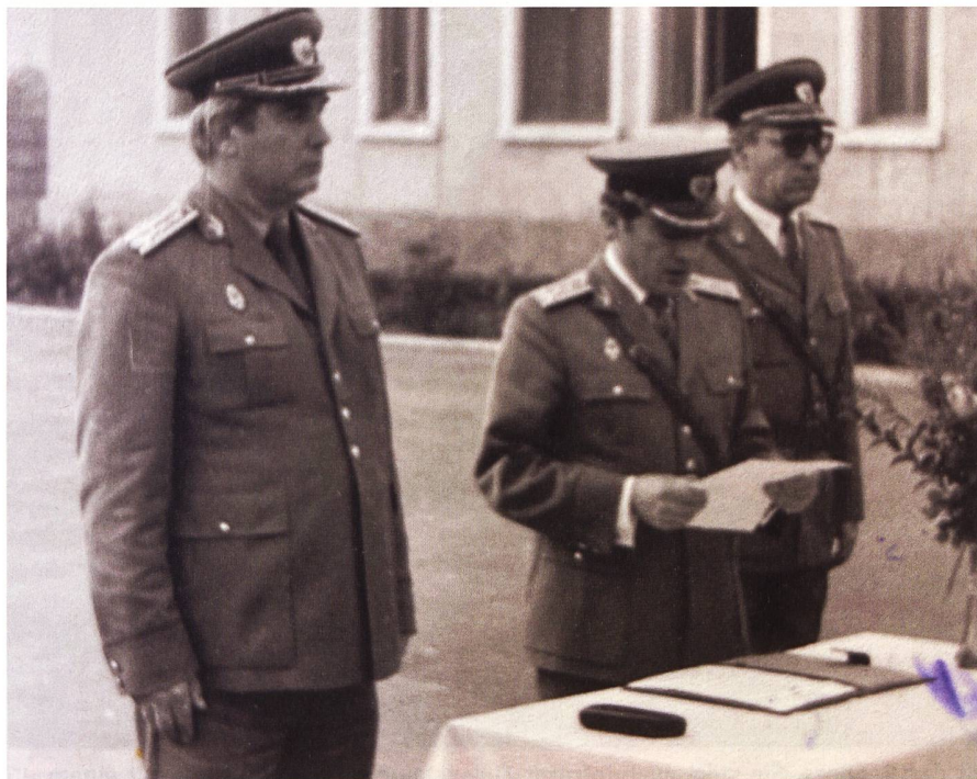
Bei der Beförderung.