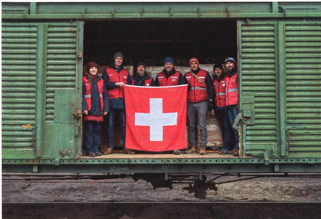
«Wir haben sechs grössere Lieferungen – insgesamt 480 Tonnen Hilfsgüter – via Polen in die Ukraine transportiert.»

fanden sich auch Beatmungsgeräte. Dank unserem Verbindungsmann konnten wir diese Lieferung an der polnisch-ukrainischen Grenze auf die Eisenbahn umladen und zwei Tage nach der ersten Lieferung (am 5. März) direkt nach Kyiv schicken.