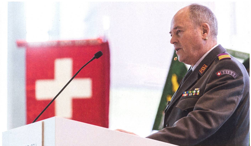
Oberst Knill: «Ohne Korrekturen muss bis 2030 damit gerechnet werden, dass das Erfolgsmodell Milizarmee ernsthaft in Frage gestellt ist.»