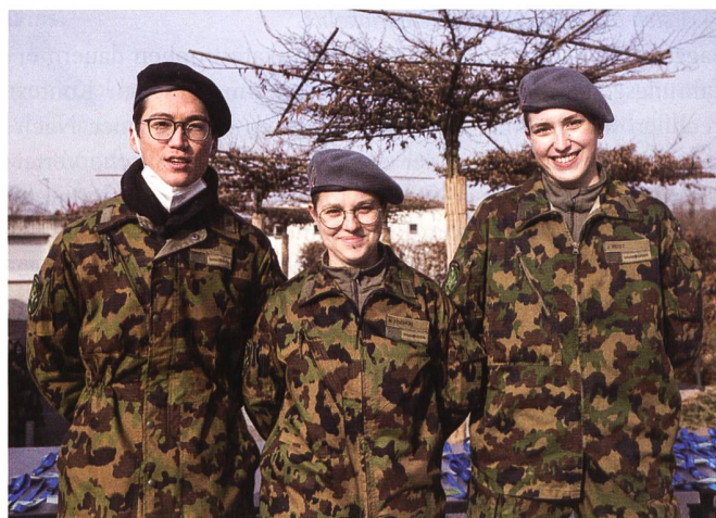
Als Gastgeber: ein aussergewöhnliches Erlebnis auch für die Rekruten der Kaserne Auenfeld.