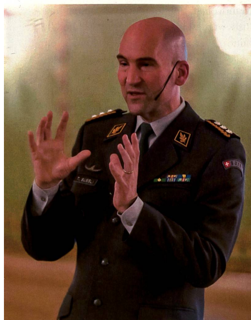
«Neue Systeme könnten aber nicht so einfach mit mehr Budget gekauft werden. Systeme, die aber gerade in Beschaffung seien, könne man einfacher dazukaufen.»

Zukunft: Die OG Panzer bringt genau so viel PS auf den Boden wie ihre Kampfpanzer. +