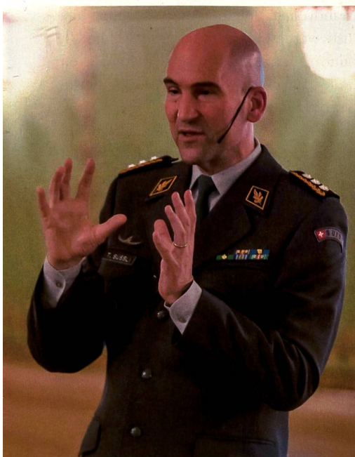
«Neue Systeme könnten aber nicht so einfach mit mehr Budget gekauft werden. Systeme, die aber gerade in Beschaffung seien, könne man einfacher dazukaufen.»

Zukunft: Die OG Panzer bringt genau so viel PS auf den Boden wie ihre Kampfpanzer. +