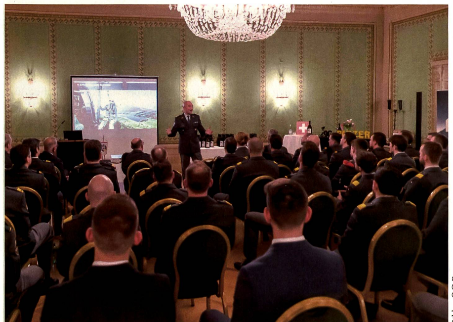
«Eigentlich müsste die OG Panzer die OG Cyber sein», so der Chef der Armee zum Digitalisierungsgrad der OG.