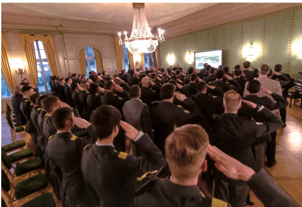
Teilnehmer-Rekord: 101 Mitglieder an der Generalversammlung.

Der Chef der Armee beantwortete im Anschluss die Fragen der OG Panzer. Zuerst nahm er zu den Forderungen von Maj a D