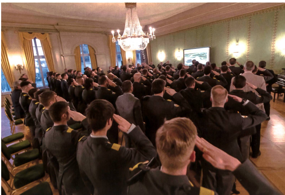
Teilnehmer-Rekord: 101 Mitglieder an der Generalversammlung.

Der Chef der Armee beantwortete im Anschluss die Fragen der OG Panzer. Zuerst nahm er zu den Forderungen von Maj a D