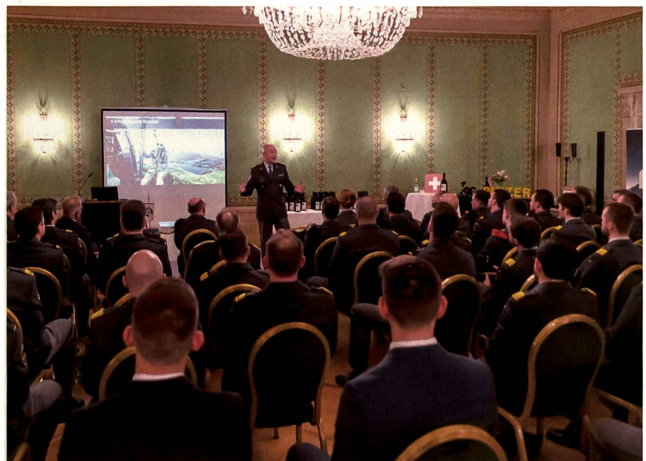
«Eigentlich müsste die OG Panzer die OG Cyber sein», so der Chef der Armee zum Digitalisierungsgrad der OG.