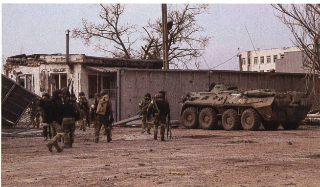
Russland führt das Gefecht streng hierarchisch. Der Verbund der Teilstreitkräfte funktioniert scheinbar nicht.

Funknetze der russischen Streitkräfte werden aufgeklärt. Dann erfolgen Überfä-