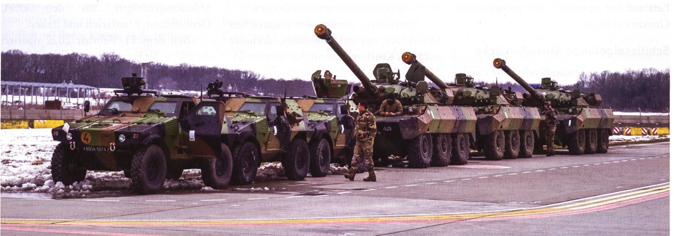
Per 16. März 2022 befinden sich an der NATO-Ostflanke 40 000 Streitkräfteangehörige unter direktem NATO-Kommando. Im Bild: französische Truppen.