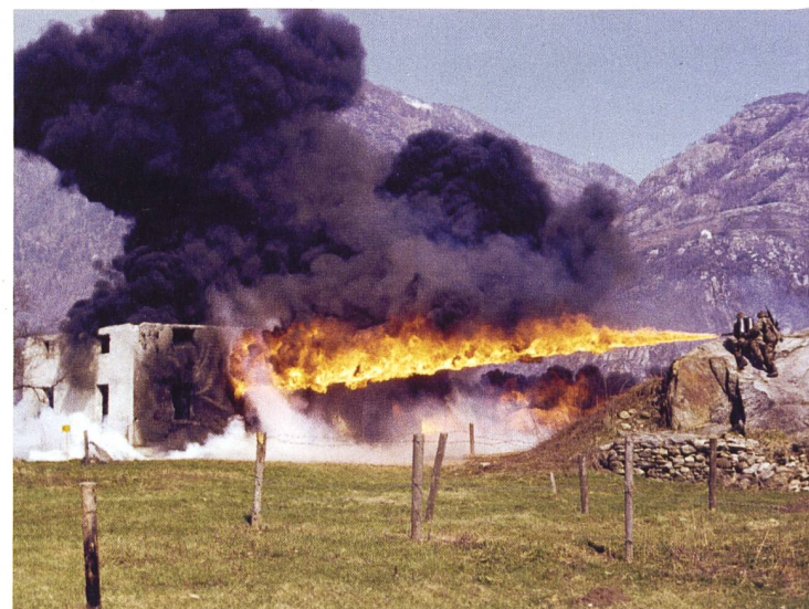
Grenadiere im Häuserkampf mit dem Flammenwerfer.