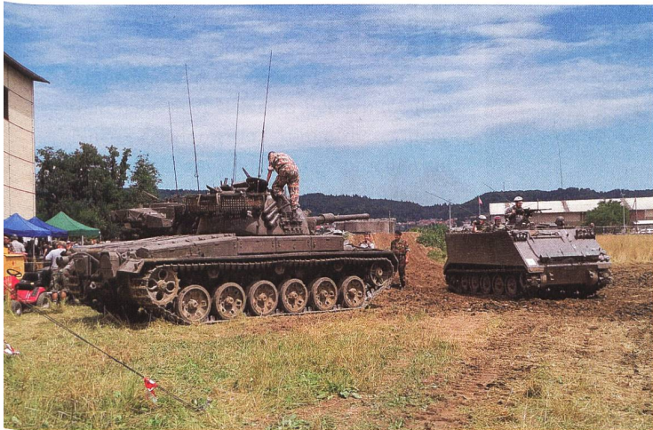
Lebendige Geschichte: Am Panzerweekend erwachen die Panzer wieder zum Leben.