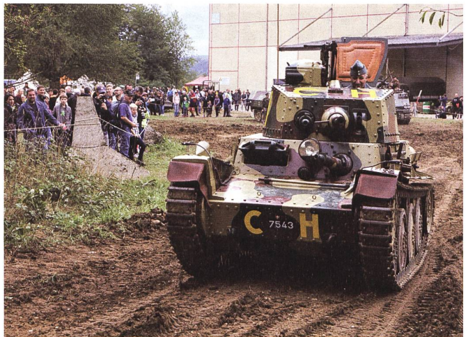
Damit diese historischen Fahrzeuge wieder rollen können, braucht es viel Herzblut und Vorbereitungszeit.

seher Seite auf Stufe Truppenkörper je gegeben hat, stempelmässig durchführen, kommentierte der anwesende Experte. Die sprichwörtliche deutsche Bürokratie wurde eben nicht nur in Friedenszeiten korrekt durchgeführt.