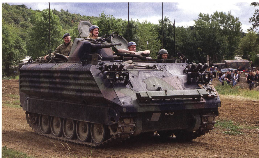
Ein Highlight des Panzerweekend 2022: Einmal in einem Schützenpanzer mitfahren. In diesem Beitrag werfen wir einen Blick auf die Vorbereitungsaufgaben des Anlasses.

Damit liesse sich jeder administrative Vorgang den es im 2. Weltkrieg auf deut-