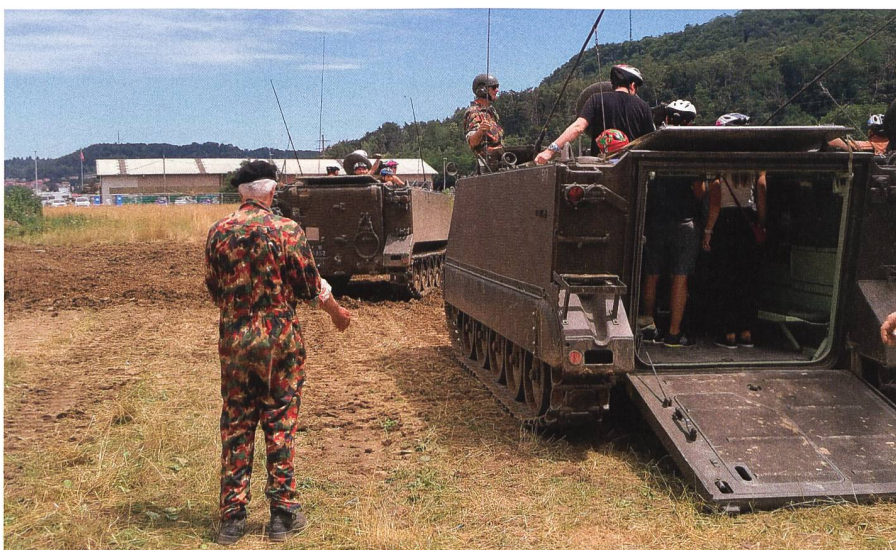
Dank 135 Helfer im Einsatz konnten auch Rundfahrten angeboten werden.

Das Panzerweekend Full und der dahinterstehende Museumsverein hat das Anliegen, die Vergangenheit greifbar und erlebbar zu machen. Umso wichtiger ist es, die Gegenwart nicht ausser Acht zu lassen. +