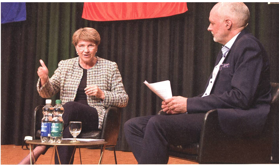
Zur Beschaffung von Kampffjets: «Wir können diese nicht einfach an der nächsten Ecke kaufen.»

tel der Armee richten sich nach den zur Verfügung stehenden Finanzen.»