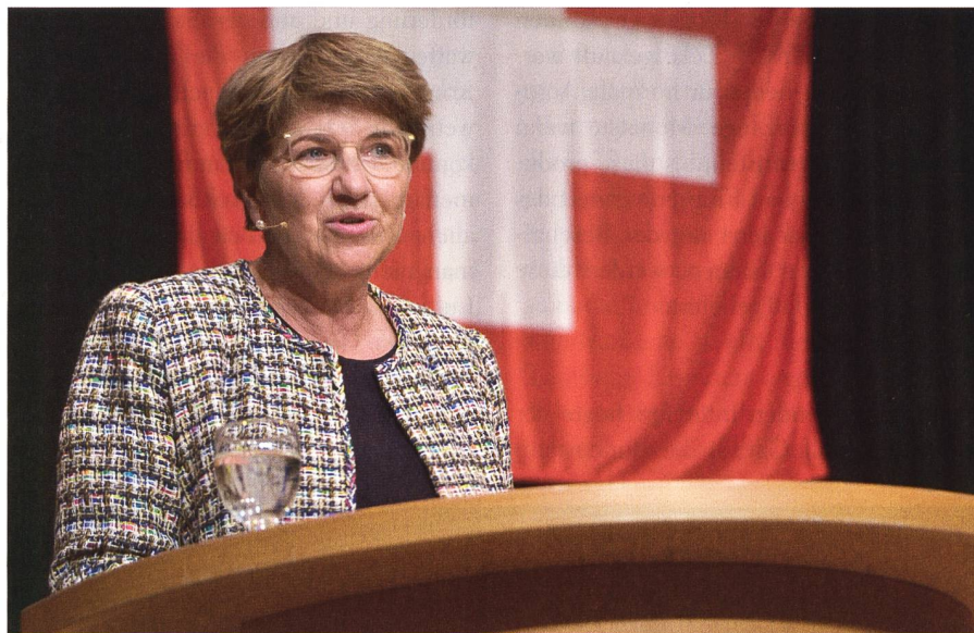
Bundesrätin Amherd: «Dieser Krieg wird mit zunehmender Brutalität geführt».

Die Chefin des Eidgenössischen Departements für Verteidigung, Bevölkerungsschutz und Sport war von der SVP Holziken zu einer Podiumsveranstaltung eingeladen worden. Das Thema: «F-35 - Sicherheit am Schweizer Himmel».