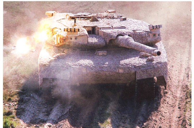
Demonstration des StrikeShield Aktivschutzsystems auf einem Leopard 2.

ren – nach dem Motto: «Never change a running system!») Somit dürfte die Mobilität sehr ähnlich zum Leopard 2 ausfallen.