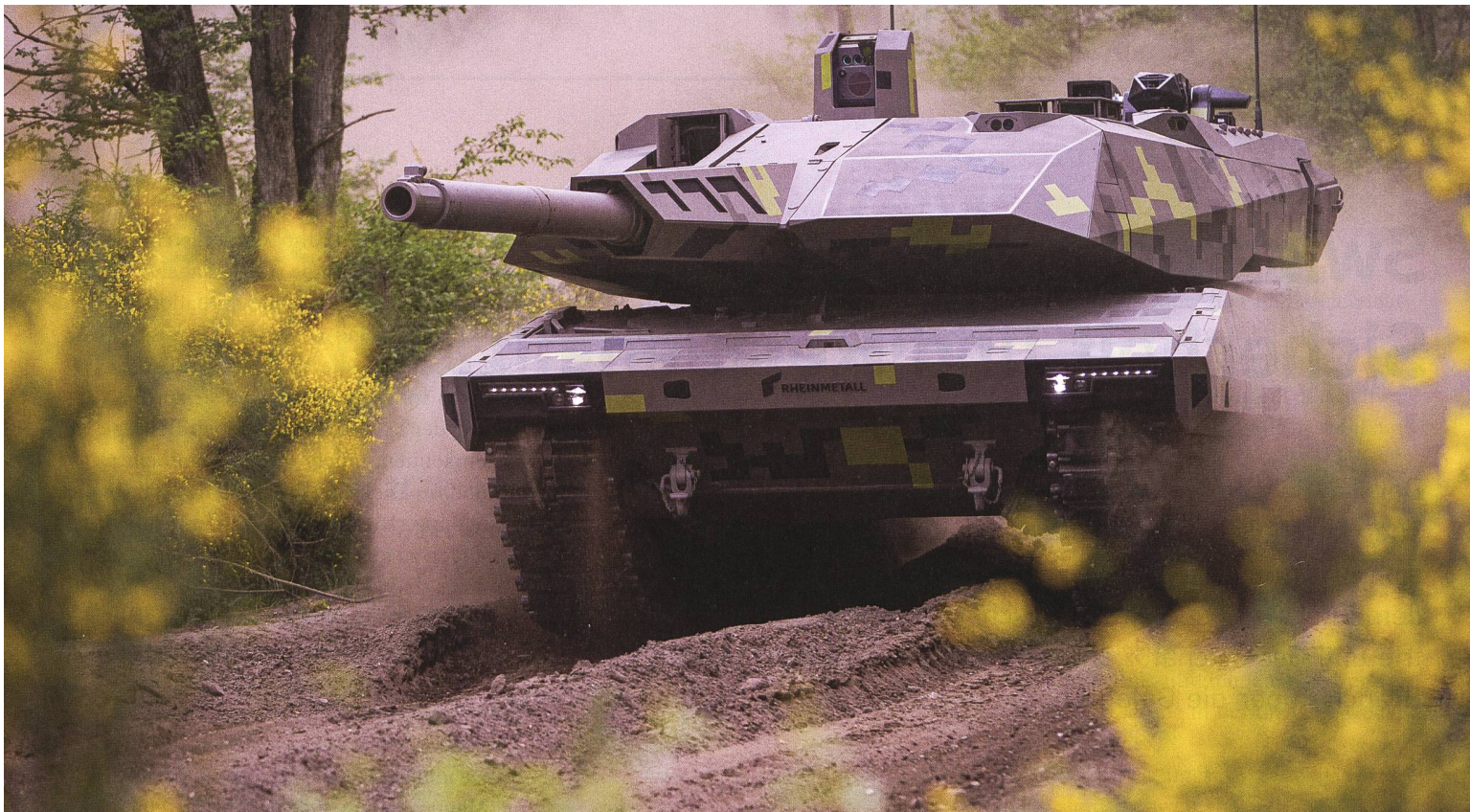
KF51 Panther: Sein Name erinnert an den damals technisch sehr fortschrittlichen Panzerkampfwagen V Panther (Sd. Kfz. 171) der Wehrmacht.