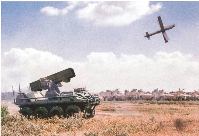
HERO-120 Loitering Munition: Diese Kamikaze-Drohne, von denen vier Stück mitgeführt werden, kann sowohl als Sensor als auch als Effektor eingesetzt werden.