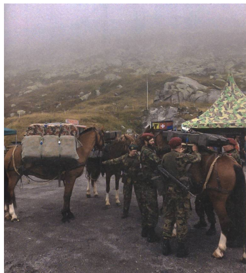
Mit von der Partie waren die Trainsoldaten der Schweizer Armee. Bei dichtem Nebel präsentierten sie ihr Können.