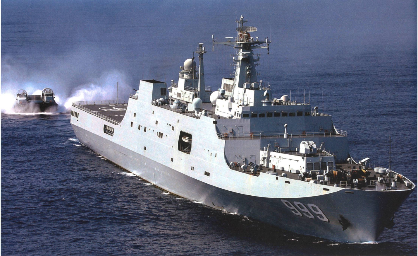
Zu den neueren Einheiten der amphibischen Flotte Chinas gehören die Docklandungsschiffe des Typs 071, die bei einer Invasion von Taiwan ebenfalls beigezogen werden dürften. Hier die «Jianggang Shan», die eben ein Luftkissenfahrzeug, ähnlich den amerikanischen LCAC, ausgesetzt hat.

zügen umgeben sind, wird China auf die Inbesitznahme von Hafeneinrichtungen angewiesen sein, über welche die riesigen Mengen an Besatzungstruppen (Landstreitkräfte) und Logistikgüter wesentlich reibungsloser an Land gebracht werden können, als über Küstenstreifen.