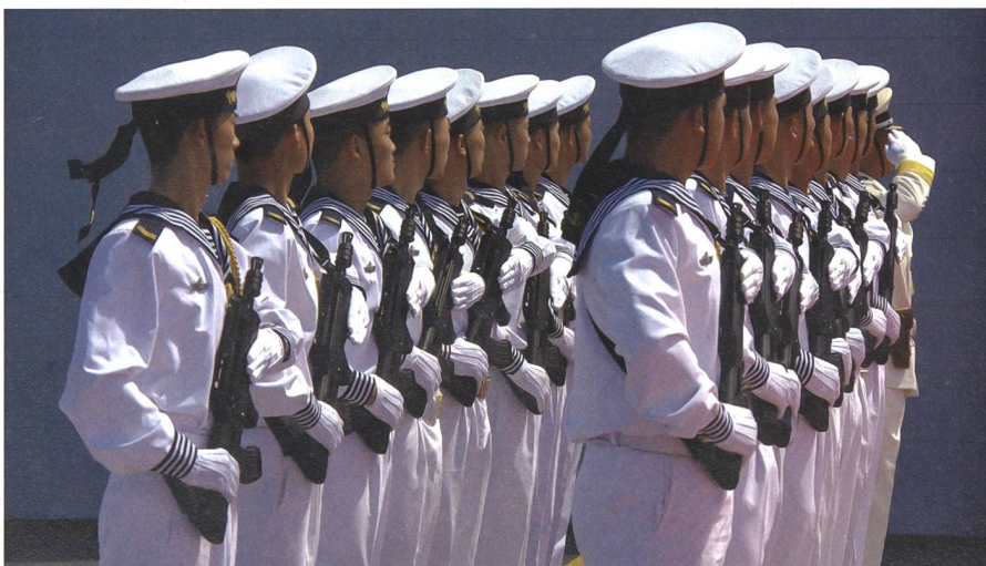
Matrosen auf dem Helikopterdeck der chinesischen Raketenfregatte «Huangshan».