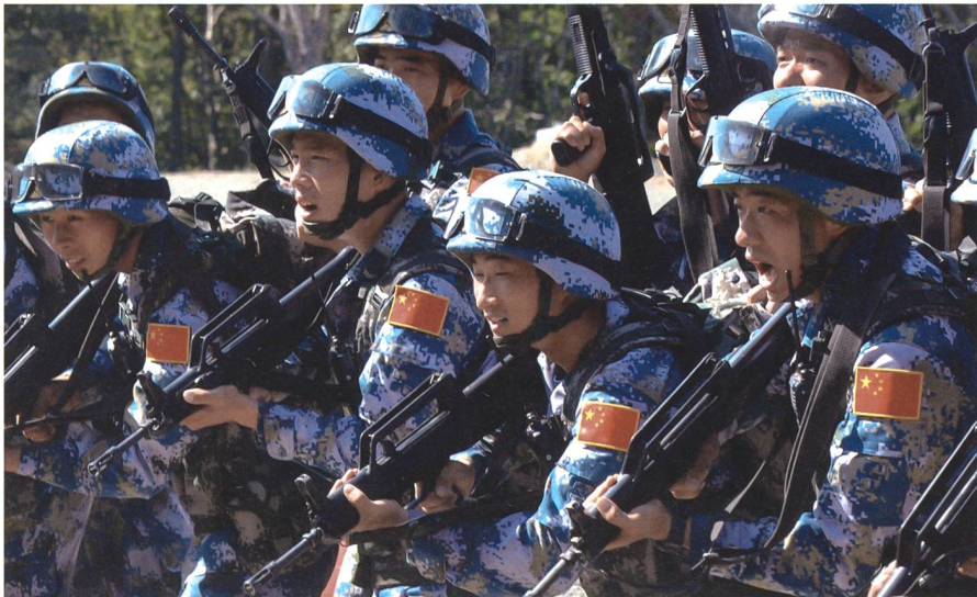
Angehörige des Marine Corps der Marine der Chinesischen Volksbefreiungsarmee, der People's Liberation Army Navy Marine Corps, PLANMC.

Obschon besondere Anstrengungen im Gange sind, lassen das Verteidigungs-