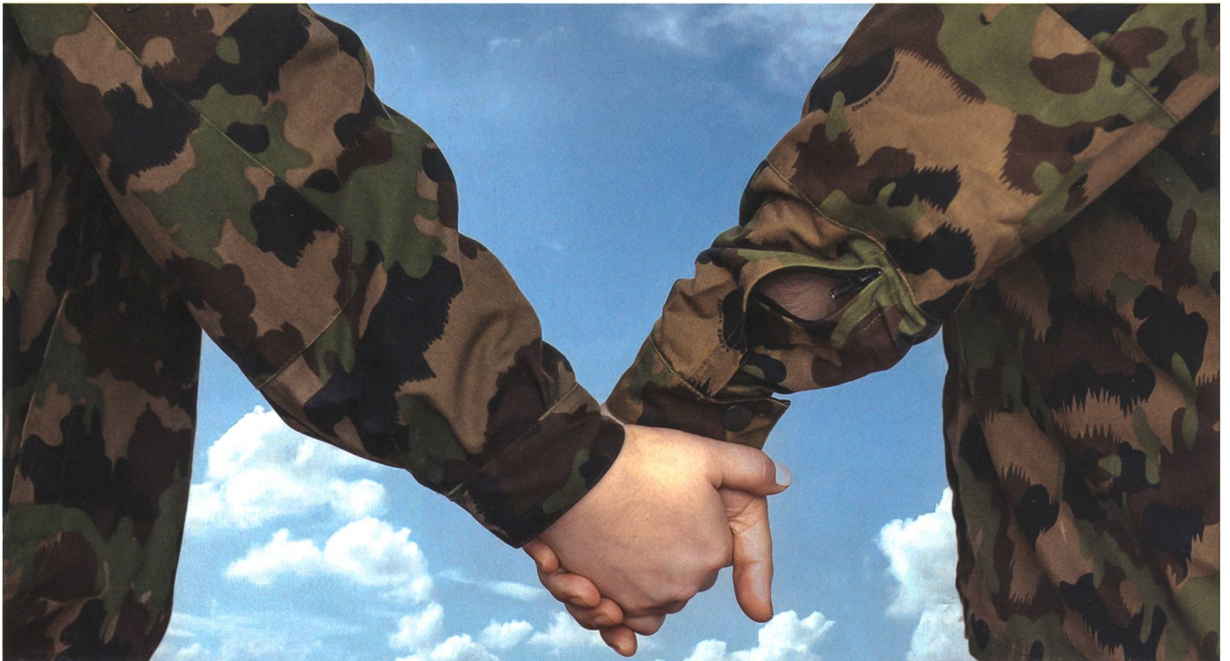
Das Militär schweisst zusammen und enge Freundschaften entstehen. Manche rücken noch näher zusammen und es kommt zu einer Liebesbeziehung (Symbolbild).