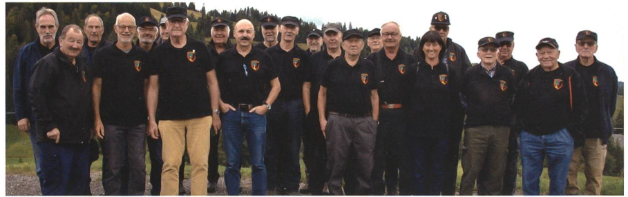
Gruppenbild der Teilnehmenden am Veteranenwettkampf, Sektion UOV Veteranen Amt Erlach.

Nach einem stärkenden Kaffee und Sandwiches ging es zum ersten Posten, bei welchem die Flugzeugkenntnisse, auch von Modellen aus früheren Zeiten, getestet wurden. Weiter gehörten das Distanzschätzen und das Festlegen des Gewichtes eines bestimmten Steins zu den Aufgaben. Da wir als Berner Seeländer mehr die Distanzen in der Ebene gewohnt sind, bekun-