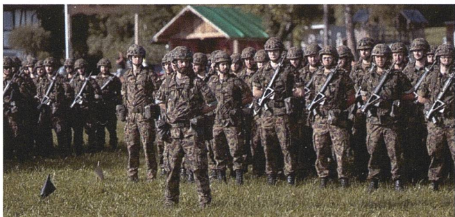
Der diesjährige WK fand im Raum Zürcher Unter- und Oberland statt.