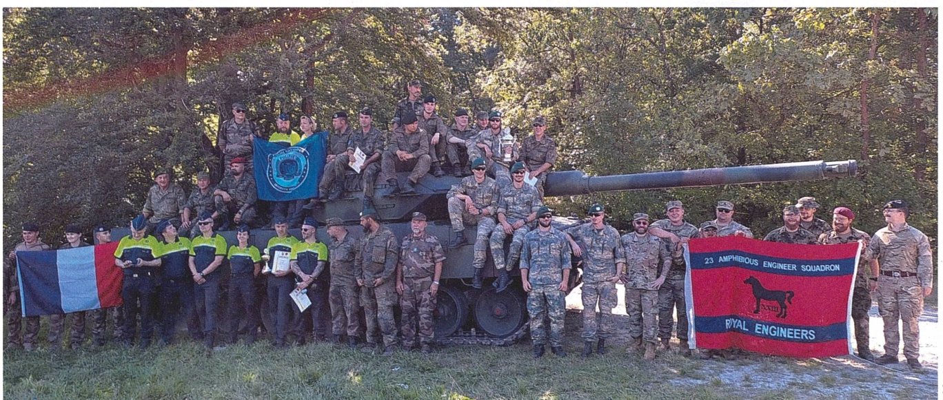
Schützenkameradinnen und -kameraden aus ganz Europa und den USA mit dem besonderen «Gast», dem Leo.

Wie bereits schöne und lange Tradition, waren alle Teilnehmenden nach der Siegerehrung zum Besuch des Schützenmarkts im Nachbarort Buchen eingeladen. Dort erwartete uns abends ein Fackelum-