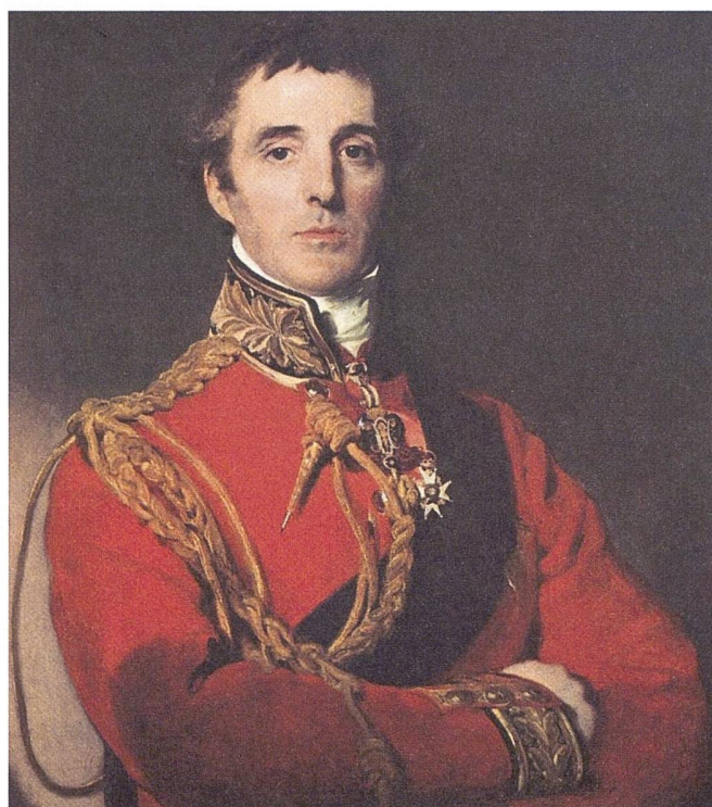
Arthur Wellesley (später Duke of Wellington; 1760-1852) setzte auf flexible Linien.