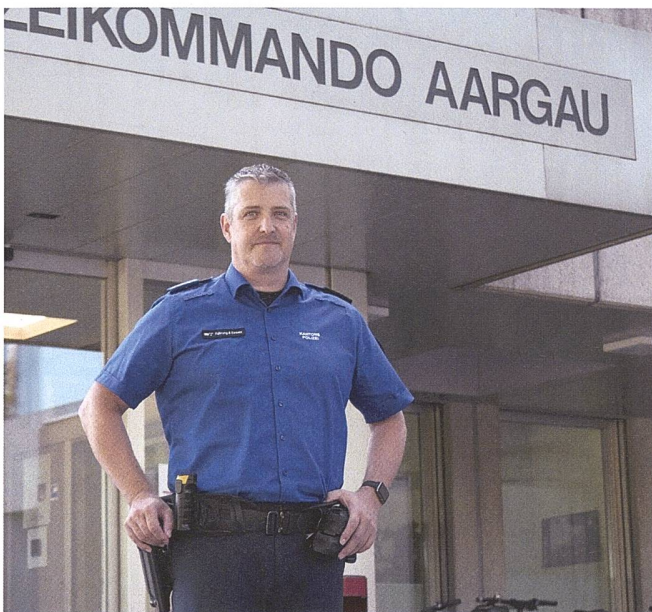
Oblt Urs Steffen ist Leiter der Kantonalen Einsatzzentrale und SPOC Militär und Polizei.