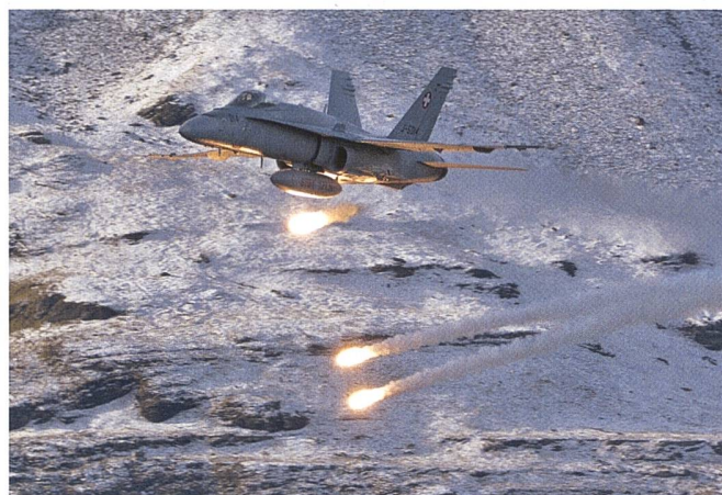
Die F/A-18 ist seit 1997 im Einsatz.