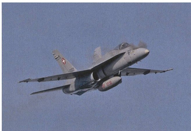
F/A-18 Hornet beim Schiesstraining.

Die Armee erwartete an beiden Tagen, dieses Jahr am 18. und 19. Oktober 2023, je 4500 Besucherinnen und Besucher. Aufgrund des schlechten Wetters musste der Trainingstag am Donnerstag jedoch abgesagt werden. Im nächsten Jahr wird das Fliegerschiessen auf der Axalp ausfallen, da die Luftwaffe ihr Können beim Event «Airspirit24» vom 30. bis 31. August 2024 auf dem Militärflugplatz in Emmen demonstrieren wird, zu dem bis zu 35 000 Besucher erwartet werden. +