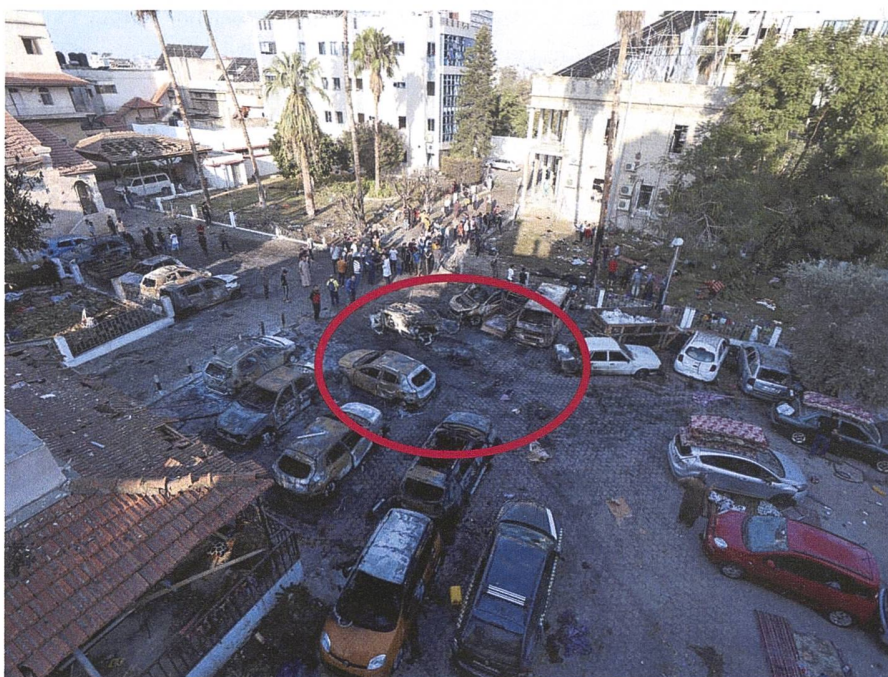
Der Parkplatz, in der Mitte der Krater.