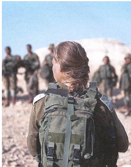
Israelische Zugführerin bei der Befehlsausgabe vor dem Angriff.

Von Norden her drohte Israel von Anfang an das Raketenarsenal der schiitischen Hisbollah. Sie steht der Islamischen Republik Iran, der Vormacht der Schia, noch näher als die sunnitische Hamas. Das Londoner Institut für Strategische Studien schätzt behutsam, die Hisbollah horte in ihren Lagern an Raketen ein Mehrfaches vom Hamas-Bestand. Vor allem reichen die Hisbollah-Missile weiter als die teils archaischen Geschosse der Hamas. Mit ihren iranischen Raketen trifft die Hisbollah Ziele tief im Süden: Städte wie Beers-