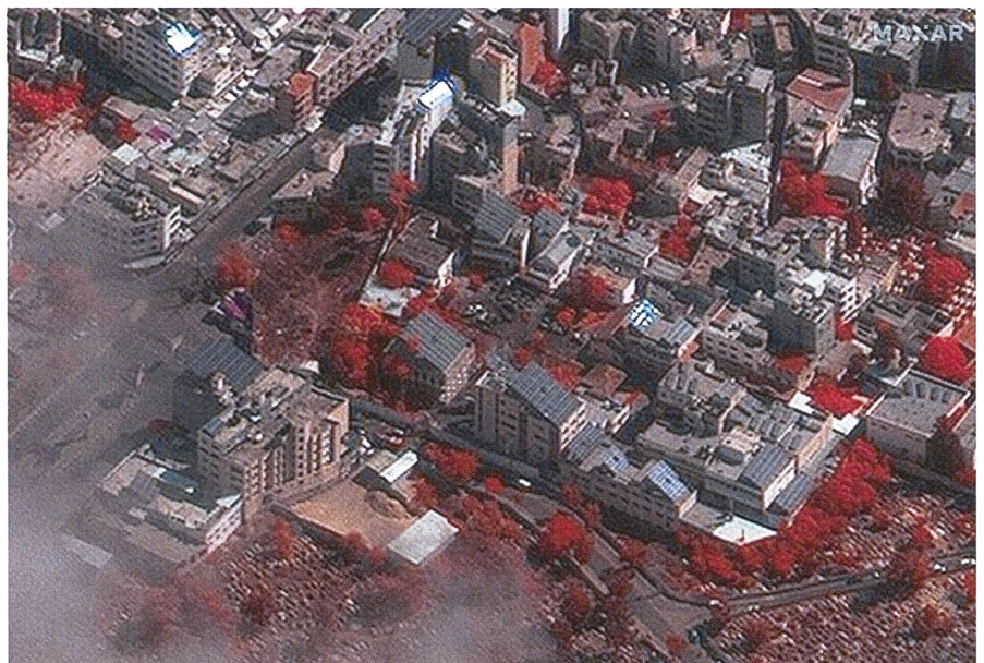
Verbrannte Bäume, nur links der Mitte beim Parkplatz.

Zu Israels ehernen Regeln gehört die Doktrin, immer müsse die Armee den Krieg auf das Territorium des Gegners tragen. 1956, 1967, 1973, in beiden Libanon- und vier Gazakriegen tobten die Schlachten in feindlichen Gefilden. Jetzt aber stiessen die Mordbuben kilometertief in israelisches Staatsgebiet vor. Vier fürchterliche Tage hatte Israel den Krieg im eigenen Land. Als das Fernsehen Sendung um Sendung mit dem Satz ankündigte: «Israel steht im Krieg», erkannte das Staatsvolk die bittere Wahrheit: Zum ersten Mal wieder seit 1948/49 schlug der Feind im israelischen Kernland zu. Und Zahal, die eigene Armee, rang nicht um den Sinai, nein, sie rang um zwei Dutzend angegriffene Städte, Siedlungen und Kib-