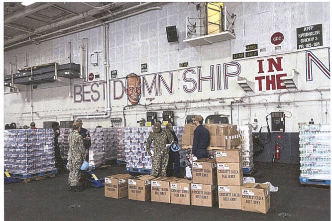
Auf dem Hangardeck der «Ike» türmen sich die Lebensmittel, die vor der Einsatzfahrt des Trägers an Bord gebracht werden. Für die rund 5000 Seeleute an Bord sind gewaltige Mengen nötig.

Arbeit mit einem Auftrag und einem Zweck bzw. Sinn, sowie (3) auf einen Willen, erfolgreich zu sein.