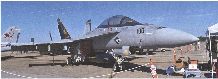
Diese F/A-18F «Super Hornet» der Fighter-Attack Squadron 32 gehört zum Marineflieger-Geschwader 3 auf der «Ike».

Flugzeugträgers etwas Privatsphäre verschafft, die er aber nur wenig und meist nur für Repräsentationszwecke nutzt. Sonst «wohnt» er in seiner wesentlich kleineren Kabine, die unmittelbar hinter der Navigationsbrücke liegt und die es ihm erlaubt, innert wenigen Sekunden dort eingreifen zu können, falls dies die Lage erfordert.