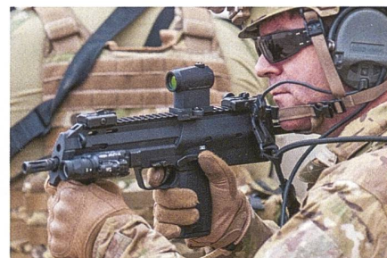
Heckler & Koch MP7 für die litauischen Streitkräfte.