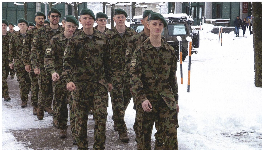
Stolze frisch beförderte Wachtmeister der Inf DD U05 14-1.