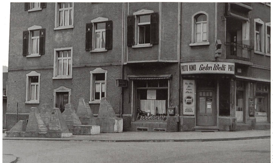
Wie soll Zürich verteidigt werden? Bunker und Höckeranlagen des Zweiten Weltkriegs sind noch heute Zeugen der Verteidigungsbereitschaft. Hier im Bild: die Sperrstelle «Panama» in Zürich Altstadt.

Das rechte Zürichseeufer, Winterthur und das Zürcher Weinland lagen vor der eigentlichen Abwehrfront. Grenzbrigaden, vorgestaffelte bewegliche Elemente und ein ausgeklügeltes Zerstörungskonzept