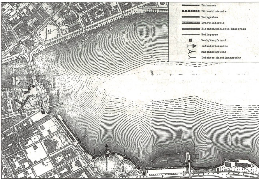
Wollishofer Sperre Ost. Ob Zürich im Kriegsfall hätte im Strassenkampf verteidigt werden sollen, war politisch und militärisch ein umstrittenes Thema.

deanlagen, das Abtragen der Bürkliterrasse sowie der Abbruch des oberen und unteren Mühlesteiges erregten heftige Proteste.