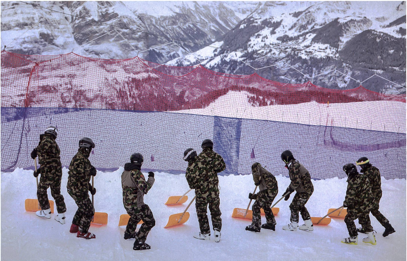
Pro: Das Rennen am Lauberhorn ist ein Anlass von nationaler Bedeutung mit definitiv internationaler Ausstrahlung (Symbolbild).

Um Ausbildungsdienstage zu sparen, lohnt es sich, andere Bereiche zu untersuchen. +