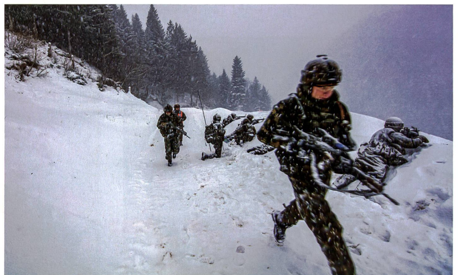
Kontra: Diese Unterstützung verbraucht Ausbildungsdienstage und diese sind vor allem in der Infanterie Mangelware geworden (Symbolbild).

Denn sie verbraucht wertvolle Dienstage. Dies führt zu Problemen in den WKs