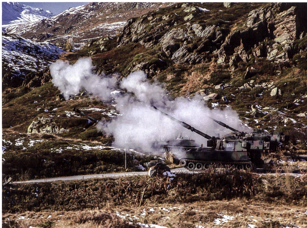
Heute haben wir die Pflicht, die gemachten Fehler mit viel Geld zu korrigieren. Es muss wieder eine Armee entstehen, die diesen Namen verdient. In diesem Sinn haben die Ständeräte am 13. Januar 2023 richtig gehandelt.

Heute haben wir die Pflicht, die gemachten Fehler mit viel Geld zu korrigieren. Es muss wieder eine Armee entstehen, die diesen Namen verdient. In diesem Sinn haben die Ständeräte am 13. Januar 2023 richtig gehandelt. Es gilt, die noch vorhandenen Kernkompetenzen für das Gefecht der verbundenen Waffen aufzubauen und zu sichern. Dazu braucht es Personal und Waffen. +