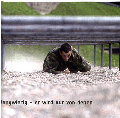
Langwierig – er wird nur von denen

Neben diesen Informationen fließen auch die Erkenntnisse aus der sogenannten Personensicherheitsüberprüfung (PSP)