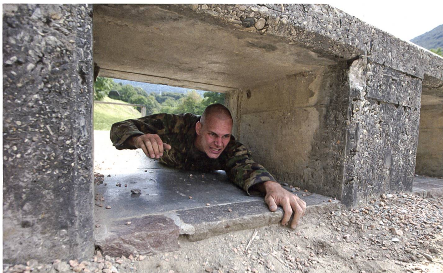
Einen kleinen Einblick kann man an einem Infoanlass gewinnen.

Egal, wie er oder sie von den Grenadieren erfahren hat und/oder motiviert wurde. Wer sich mit dem Gedanken trägt, die Herausforderungen Grenadier anzunehmen, ist sehr gut beraten, rechtzeitig