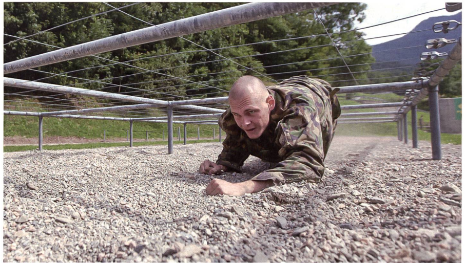
Der an der Eignungsprüfung für Grenadiere zu absolvierende Sporttest umfasst fünf Disziplinen.

Die Eignungsabklärung dauert zwei Tage und umfasst die sogenannte Sanitarische Eintrittsmusterung (SEM), eine psychische und eine physische Überprüfung.